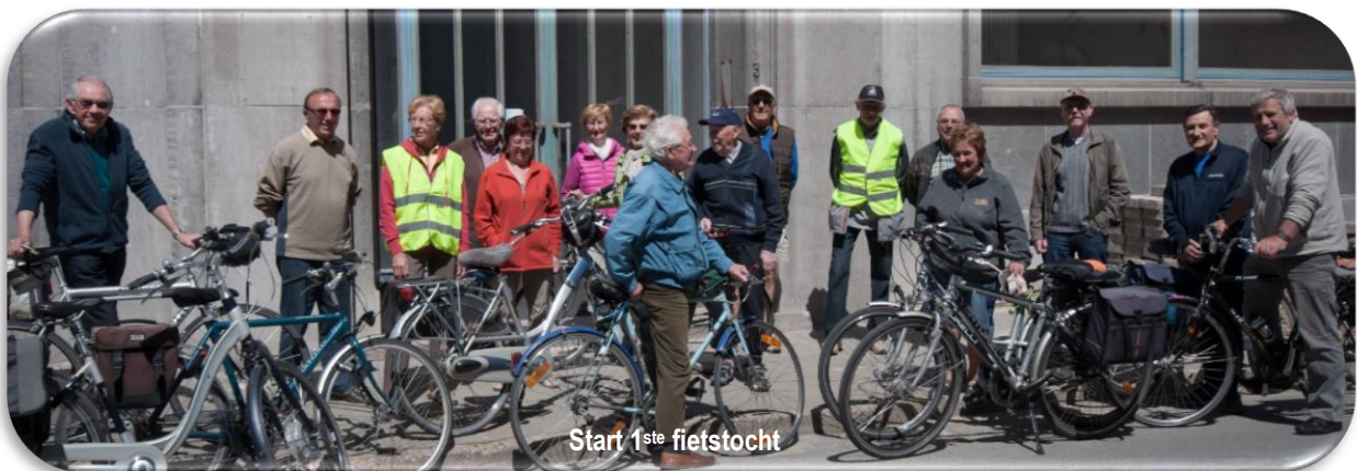
Start 1 ste fietstocht

Ondertussen is ook het fietsseizoen opnieuw gestart. De openingsrit was voorzien op donderdag 8 mei, helaas wegens de slechte weersomstandigheden kon die niet doorgaan. Toch hadden maar liefst 24 leden eraan gehouden om aanwezig te zijn bij deze openingsbijeenkomst in café: "De Most" te Oostnieuwkerke. Geïnteresseerden kunnen nog altijd meefietsen op de wekelijkse fietstochten (op donderdag).