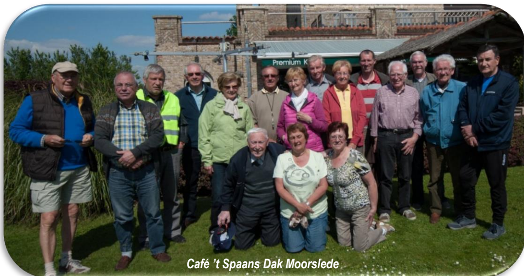
Café 't Spaans Dak Moorslede