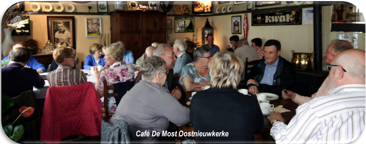
Café De Most Oostnieuwkerke

Ondertussen is ook het fietsseizoen opnieuw gestart. De openingsrit was voorzien op donderdag 8 mei, helaas wegens de slechte weersomstandigheden kon die niet doorgaan. Toch hadden maar liefst 24 leden eraan gehouden om aanwezig te zijn bij deze openingsbijeenkomst in café: "De Most" te Oostnieuwkerke. Geïnteresseerden kunnen nog altijd meefietsen op de wekelijkse fietstochten (op donderdag).