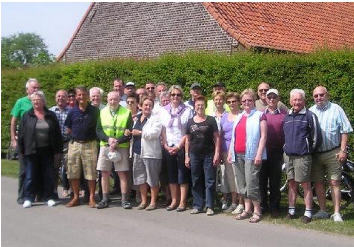
1 e fietstocht 2011 05/05/2011 – 27 deelnemers.

Ondertussen is de vriendenkring voor het 13 e seizoen gestart met zijn wekelijkse fietstochten. Op de kennismakingsrit waren maar liefst 27 leden present. Onder een stralende zon werden onze eerste kilometers van het nieuwe seizoen afgelegd.