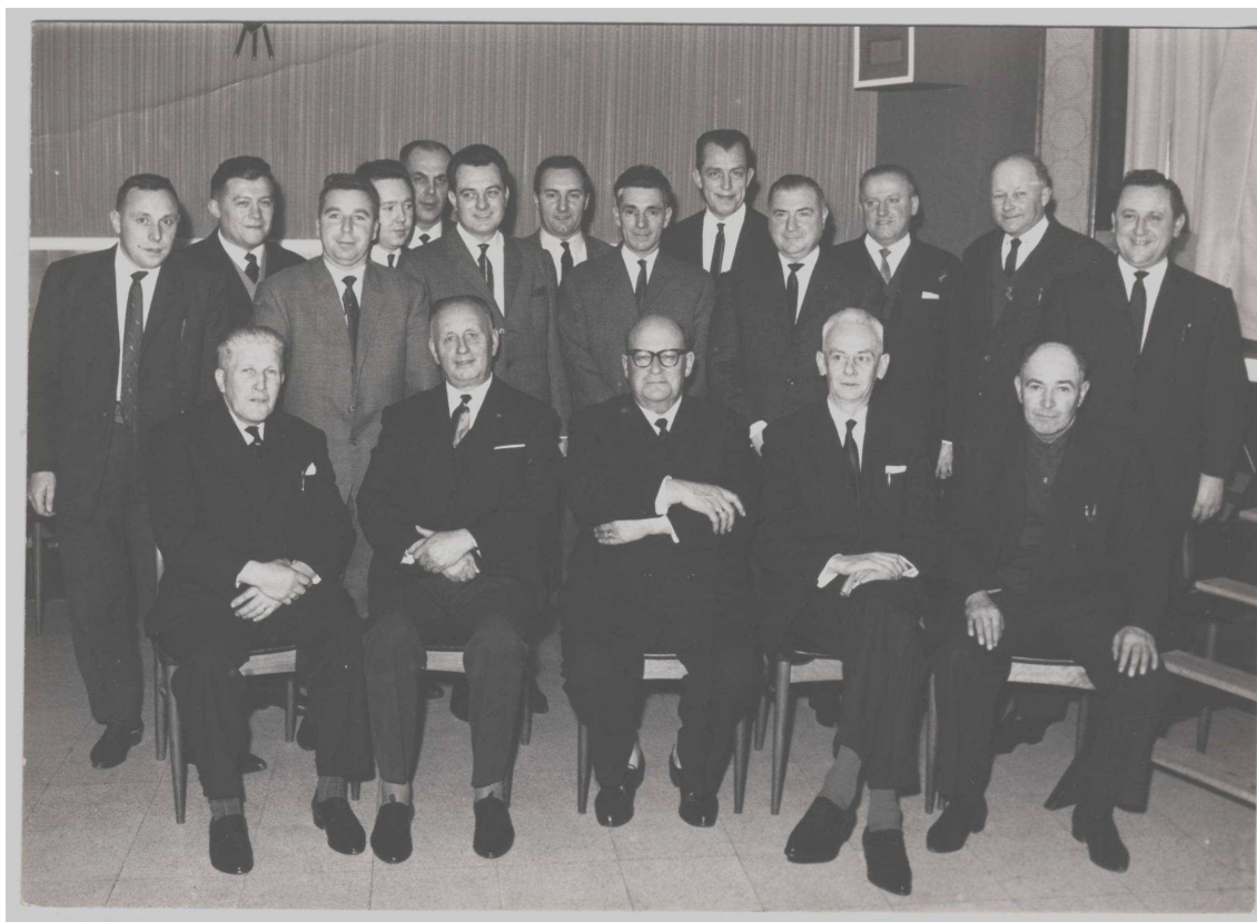
Kampioenenviering TTVK Roeselare 1964

Op de foto: de eregenodigden, de gevierden en het bestuur.