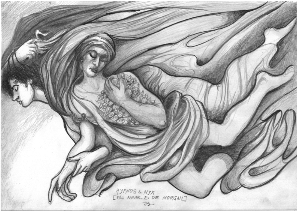
Hypnos en Nyx (De Slaap en de Nacht) [Vrij naar Everlyne De Morgan]

Elke nacht bouwde ik eraan verder. Ik begon nadat ik mijn hoofd op mijn kussen had neergelegd en ik werkte voort totdat de haan mij in de ochtend wekte. Mijn bezigheden overdag waren zowat bijzaak geworden, ik keek telkens uit naar de avond, naar bedtijd verlangde ik, en ik moest fit zijn dan, want het was een hard labeur. Overdag spaarde ik mijn krachten, ik at goed, ik nam de rustperiodes na de maaltijden in acht, ik verfriste me met nu en dan een bad, verschoonde me, verzorgde me, bezocht geregeld ook de kinesist en nam extra vitaminen.