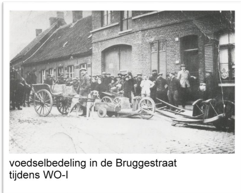
voedselbedeling in de Bruggestraat tijdens WO-I

De gemeente telt 198 herbergen of één per 35 inwoners. Er zijn nogal wat werklieden die er elke maandag een deel van hun loon verdoen. Café bezoek is voor de mannen vaak de enige vorm van ontspanning. Een gemeenteloper steekt bij valavond de schaarse petroleumlampen in het centrum aan , 4 of 5 ervan blijven gans de nacht branden.