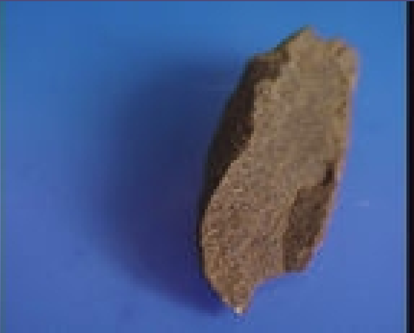
Libanese gele hasj