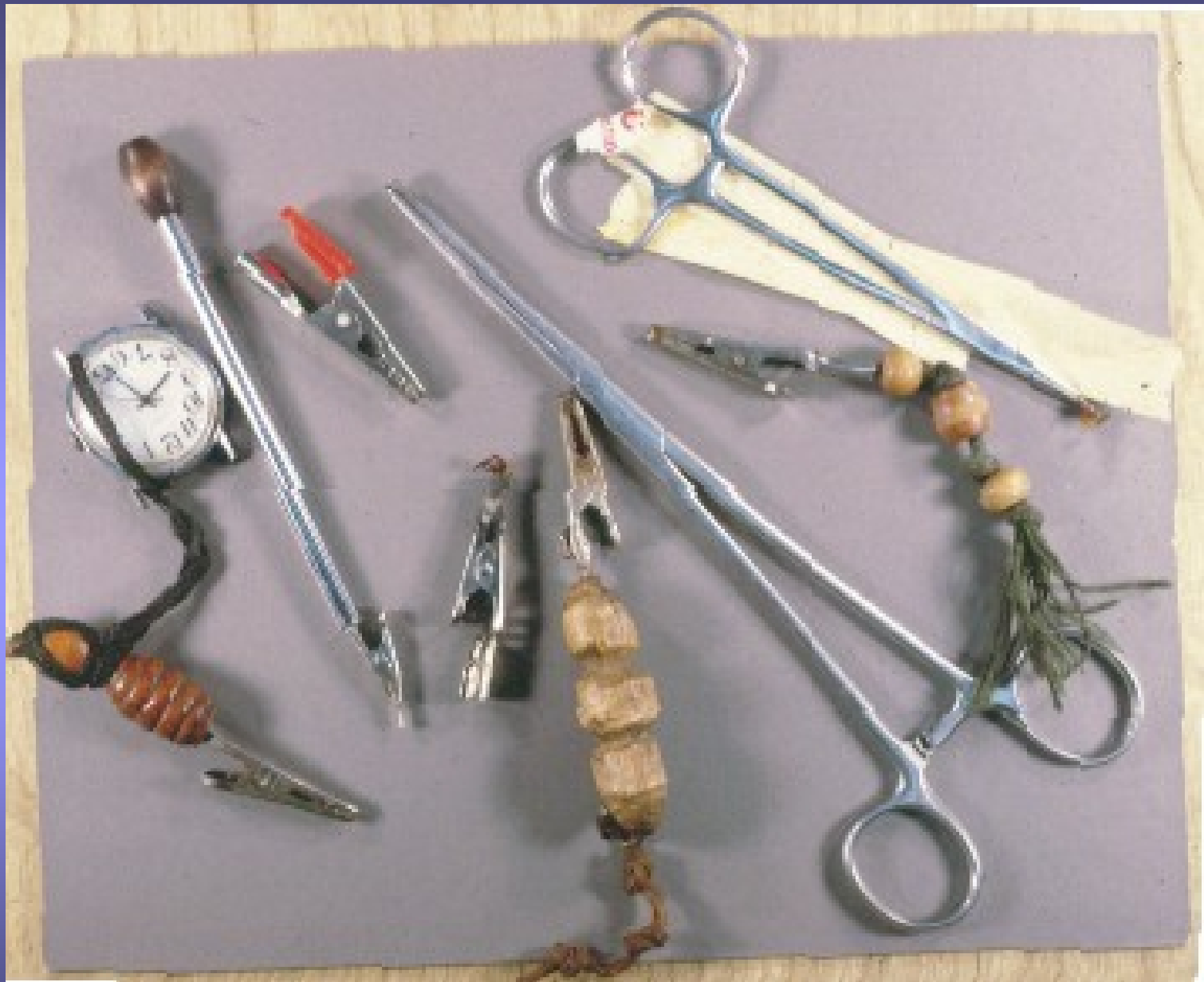
n Diverse jointclips.