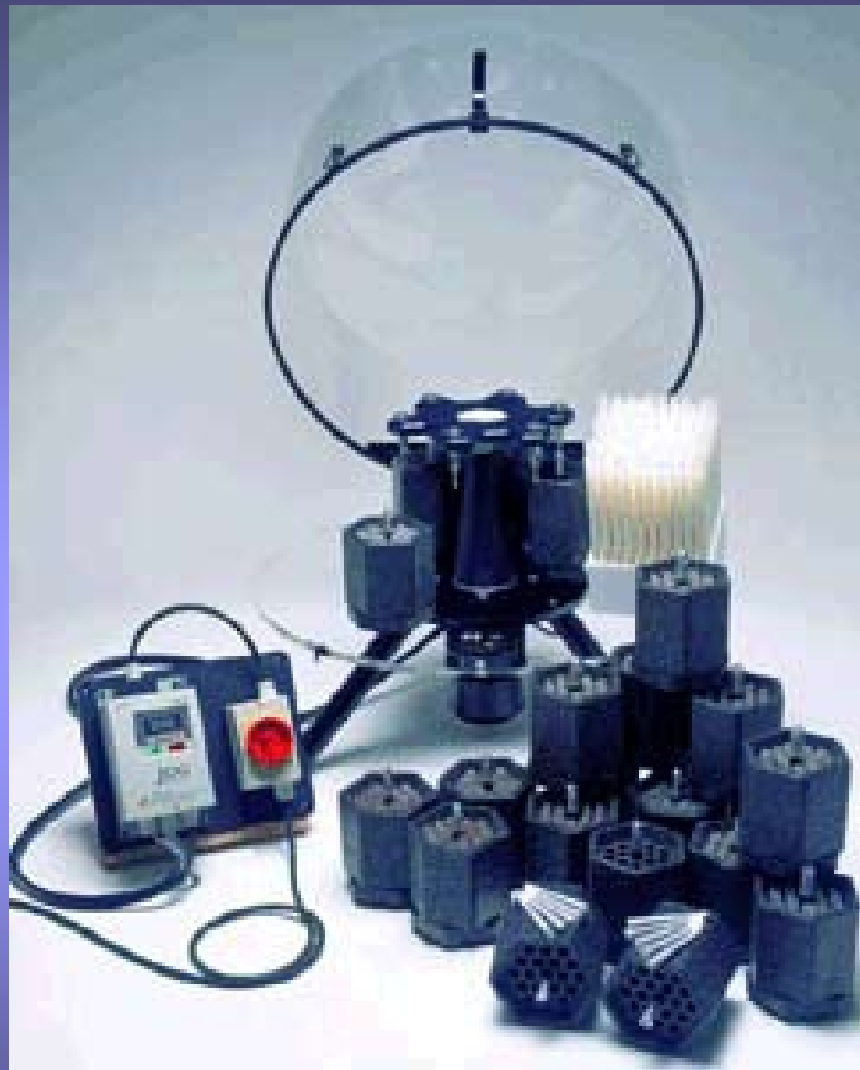
Machine om joints te vullen