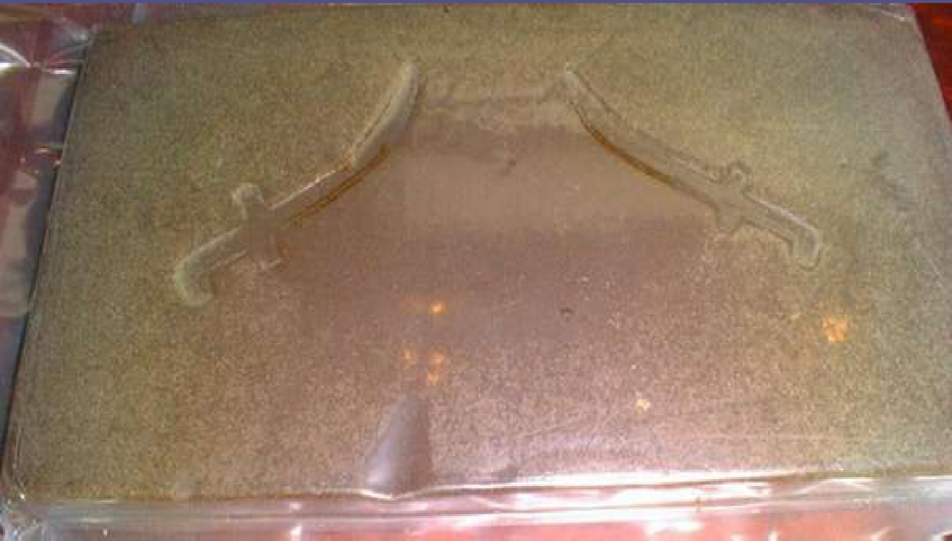
Sable hasj, Turkije