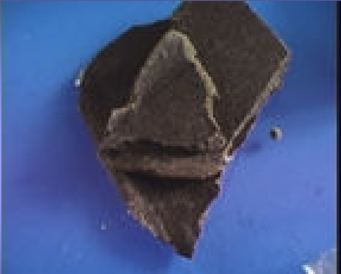
Nederlandse skuff hasj