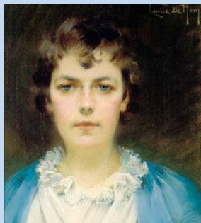
Louise De Hem (zelfportret)

Het onderwijsmuseum biedt je een mooi overzicht van de onderwijsgeschiedenis van Ieper met boeken, prenten, materieel, reconstructies,... In het Stelijk Museum wordt de geschiedenis van Ieper in beeld gebracht aan de hand van oude documenten en objecten. Het museum beschikt over een omvangrijke collectie van de Ieperse schilderes Louise De Hem.