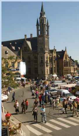
Vrijdagsmarkt in Poperinge