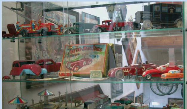
De speelgoedcollectie van Het Labyrint

ARCHEOLOGISCH MUSEUM HET LABYRINT open van 10u. - 22u., gesloten op maandag en dinsdag. Toegang is gra- tis, mits gebruik van een drankje. Dries 29, info: 057- 44 65 81