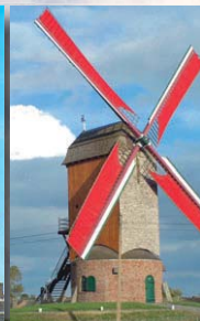
Wullepitmolen Zarren (1623)