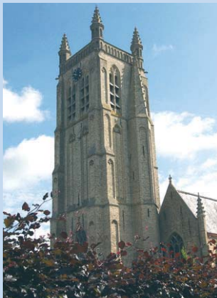
De St.-Rictrudskerk in Woesten

KINDERBOERDERIJ 'DE ZONNE-GLOED' bezoek enkel voor groepen na afspraak. Diverse activiteiten en rondleidingen, Kasteelweg 22, 8640 Oostvleteren, 0473-79.13.93 of F. 057-40.18.56