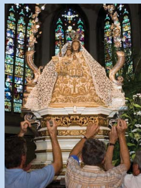
O.-L.-Vrouw van Sint-Jan

- Hengelen is toegelaten langs de IJzer en de Vleterbeek - Poperingevaart, visverlof is noodzakelijk, hengelverbod van 16/04 - 31/05