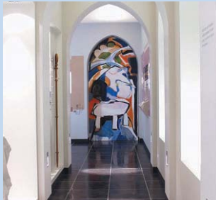
Clastrum, stijl museum over het kloosterleven.

Rechttegenover de abdij vind je "O.C. De Vrede". Binnen kan je er het "Clastrum bezoeken.