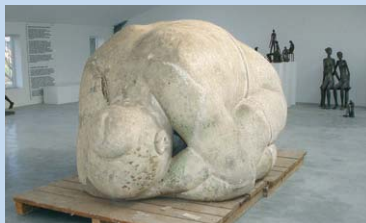
Stichting George Grard

gen open van open van 10 tot 18u. In februari, maart en november elke vrij- en zondag van 10 tot 18u. Tijdens krokus-, paas-, zomer- en herfstvakantie, iedere dag van 10 tot 18u. Groepen op aanvraag. Gesloten in januari en december. Op feestdagen van 10 tot 18u.