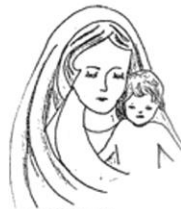
getekend door z.vianney