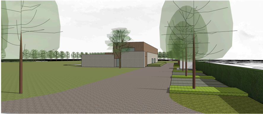
BEELD ZIJDE ASBERG

Hieronder kan u enkele 3D impressies terugvinden van het gebouw: