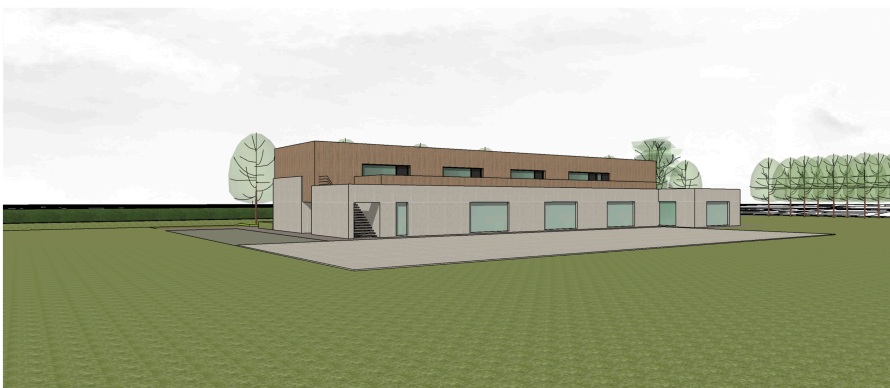
BEELD ZIJDE PLEIN