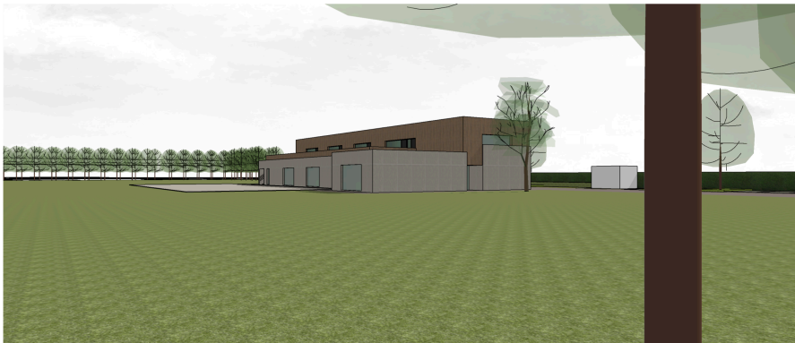
BEELD ZIJDE ASBERG