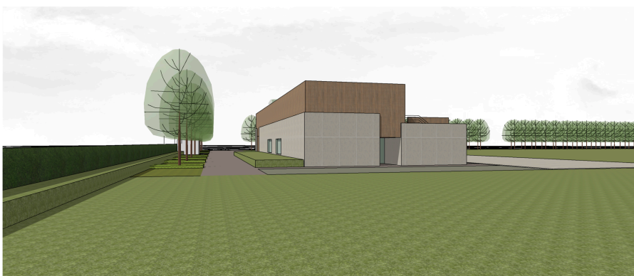
BEELD ZIJDE VIOLETTASTRAAT