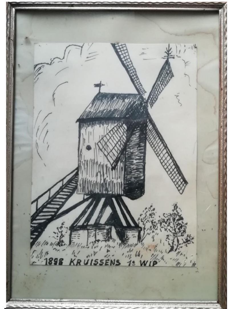
Eerste wip op de Snibbemolen van de schutters op de Kruissens. Op een ijzeren raster werden de gaaien bevestigd. Dan werden de wieken van de molen in de juiste positie geplaatst. Ziezo... de schieting kon beginnen.