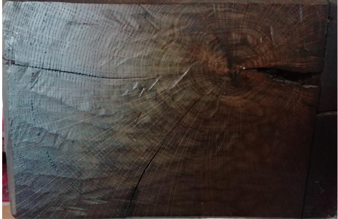
Doorsnede van de stam van de staande wip op de Kruissens. De eiken balk heeft 76 jaarringen en ligt nu als schoorsteenbalk in de woning in de Turkyestraat.