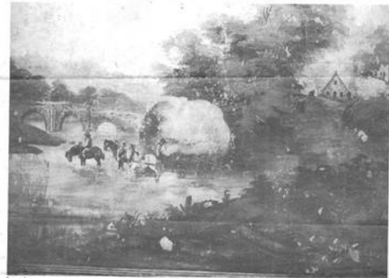
"INHALEN VAN DE OOGST". Een naamtekening werd er op de muurschildering nog niet gevonden.