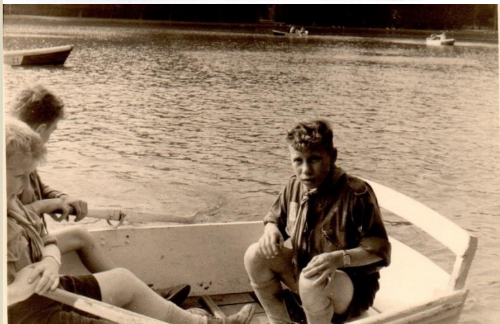
Op kamp in La Hamaide augustus μ1960