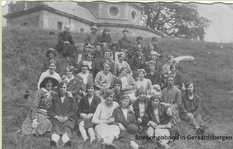
Boerinnenbond in Geraardsbergen