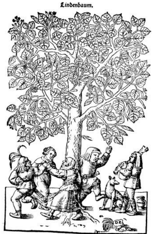
Duitse gravure uit de 16 de eeuw met vrolijk dansende dorpingen onder een bloeiende lindeboom met zijn honigzoete geur, toen nog de meest geliefde boom, ook in Vlaanderen.