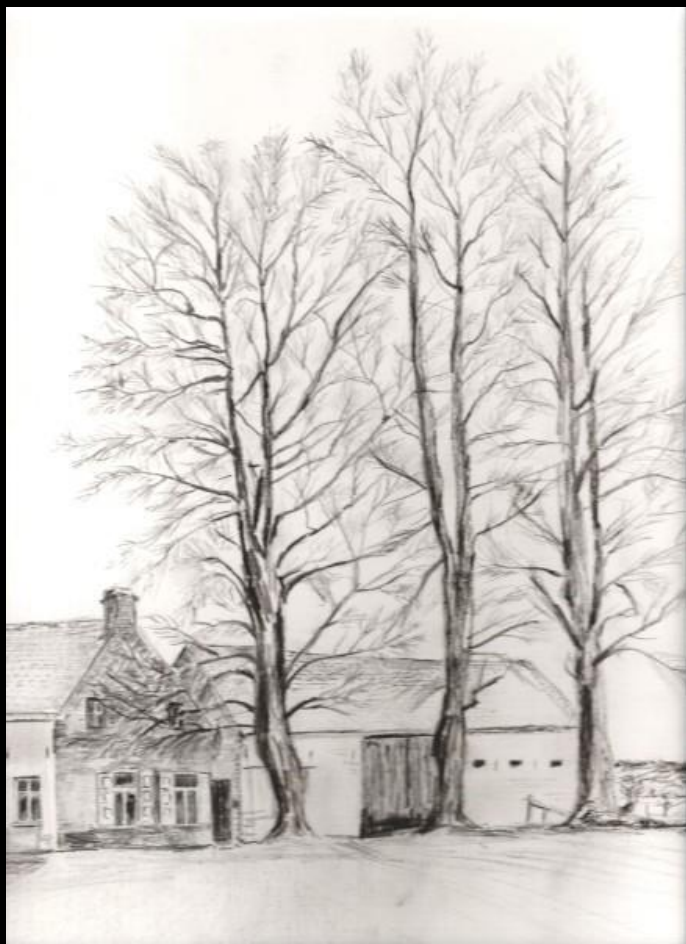
Drie mooie lindebomen aan de hoeve Verroken langs het Zeitje

Ronse. Jonge gasten riepen hem na en gooiden zelfs met brokken aarde naar hem. Reden: hij had iets op zijn kerfstok wat niet betaamde voor een priester.