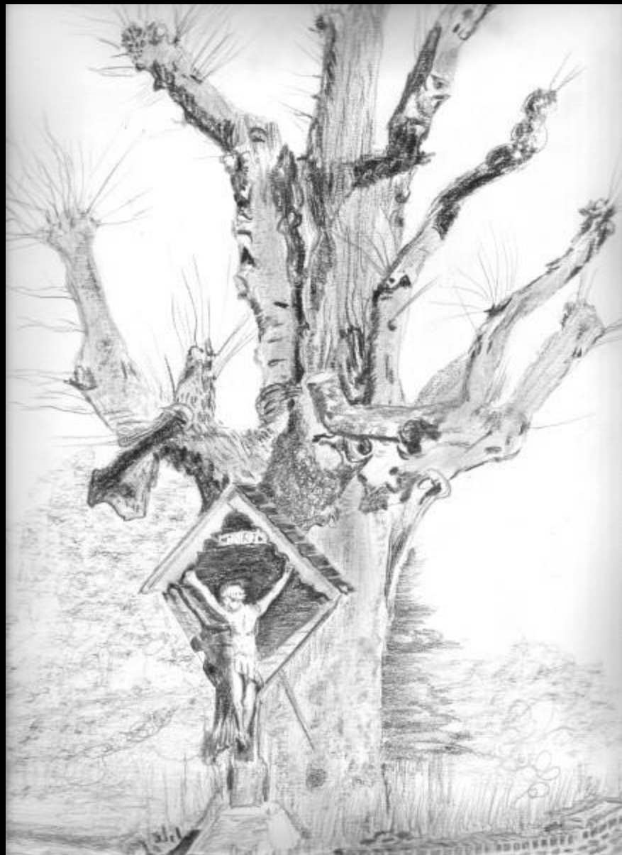
Veldkruis aan een lindeboom langs de Ninovestraat met hoek Oscar Delghuststraat in Ronse.