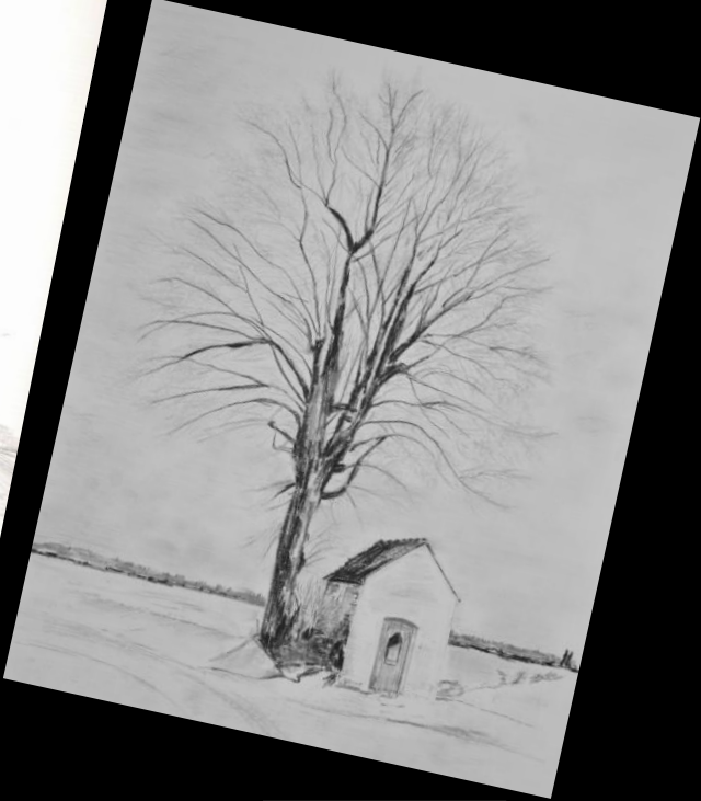
De Rode Haan