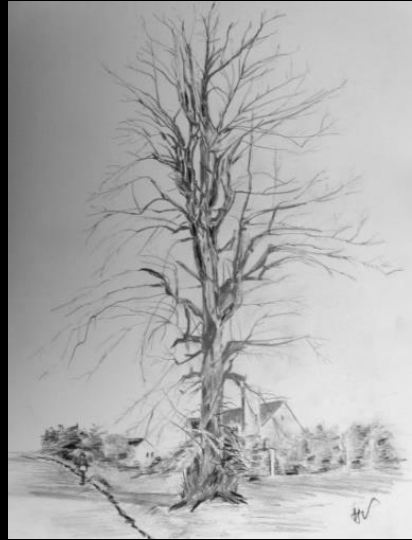
Langs de Pontstraat (gesneuveld)