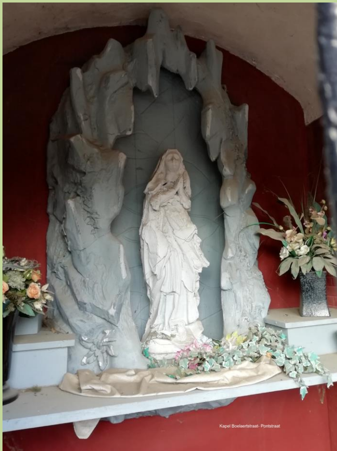
Kapel Boelaerdstraat- Pontstraat