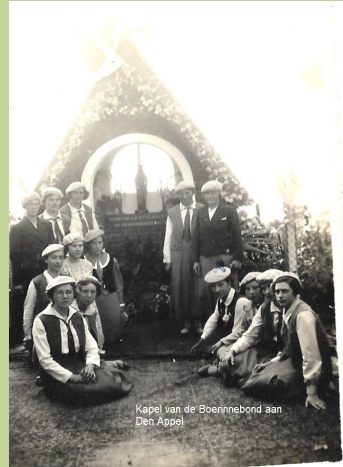
Kapel van de Boerinnebond aan Den Appel