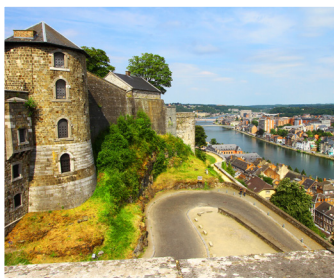
Citadel van Namen

Neos vzw, Mercatorstraat 92, 9100 Sint-Niklaas. Nog vragen? Mail of bel gerust 03/213 92 60.