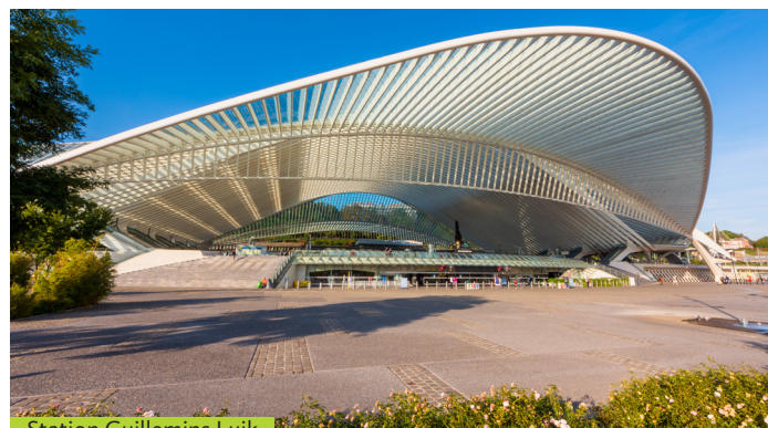
Station Guillemins Luik

Een bezoek aan het meesterwerk van Calatrava, het station van Luik , en het Museum voor Schone Kunsten La Boverie staan donderdag op de planning.