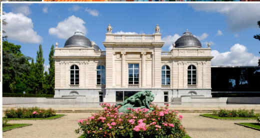
Museum voor Schone Kunsten 'La Boverie'