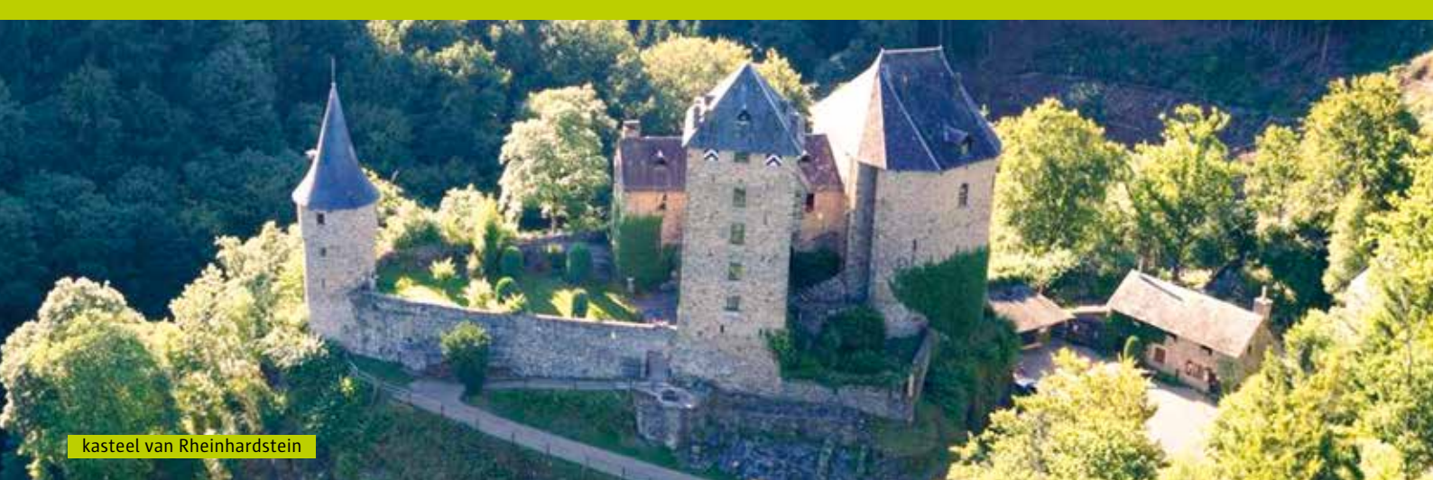
kasteel van Rheinhardstein