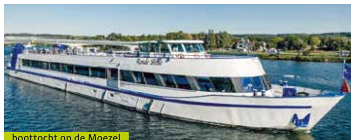
boottocht op de Moezel

Tijd voor een drankje met meer allure en dat vind je bij Bernard Massard, producent van mousserende wijnen. Je leert er de kneepjes van het vak kennen en uiteraard proeven. Na de lunch rijden we door naar Remich, waar je de dag helemaal ontspannen kan afsluiten met een boottochtje op de Moezel.