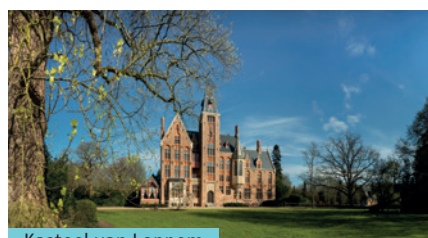
Kasteel van Loppem

Ga terug in de tijd met een bezoek aan het Kasteel van Loppem en maak kennis met het dagelijkse leven van deze