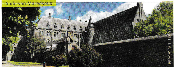
Abdij van Maredsous

Natuurlijk ga je als echte Bourgondiër op pad om de geneugten des levens te ontdekken. Zo breng je tijdens de daguitstap een bezoek aan de Abdij van Maredsous , waar je de pracht van de abdij kan bewonderen en kan genieten van hun hemelse kaas en bier. Vervolgens kan je de rijkdommen van de Tuinen van Annevoie ontdekken, een echte aanrader. Met de kleine excursie op donderdag ga je dan weer op ontdekking in het majestueuze Luik . Tijdens een bustour en ontspannend boottochtje ontdek je de pracht en praal van de stad.