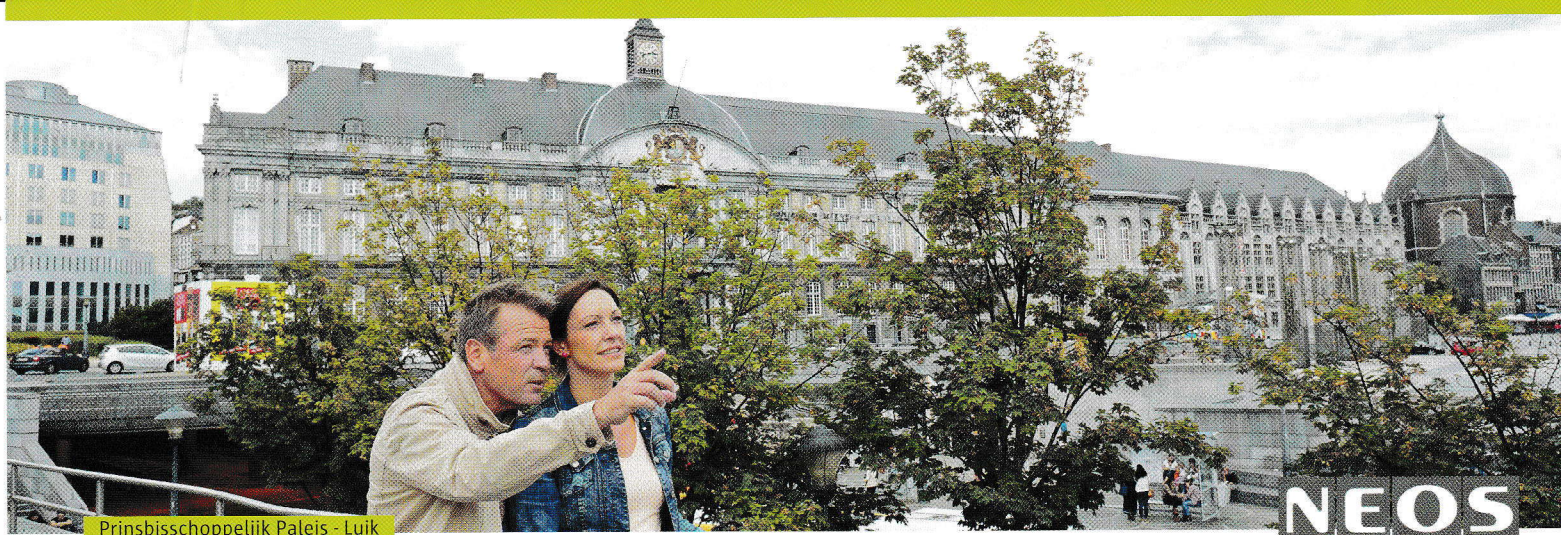
Prinsbisschoppelijk Paleis - Luik