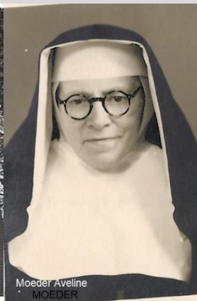
Moeder Aveline MOEDER