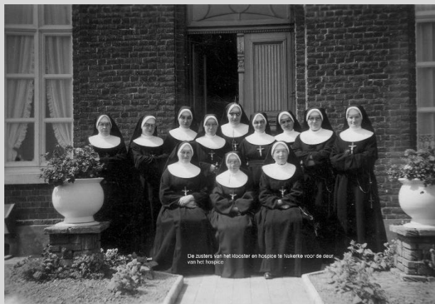
De zusters van het klooster en hospice te Haverke voor de deur van het hospice.