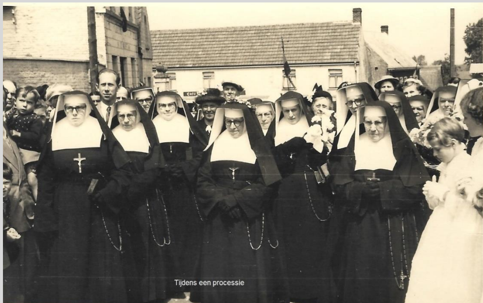
Tijdens een processie