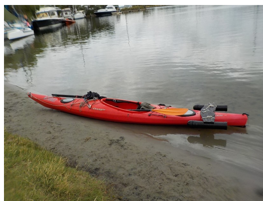
Archieffoto “Wing” op het achterdek

Bij aankomst aan de Oosthaven was het weer rustig geworden en konden we in het zonnetje inpakken en huiswaarts keren.