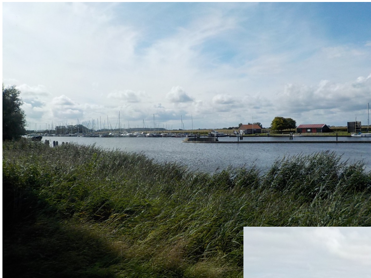
Het Volkerak naar Oude Tonge