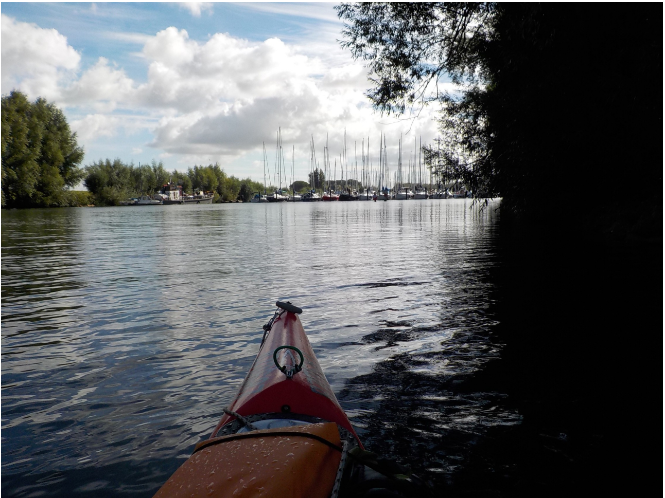
Even de jachthaven van De Put binnen om de jachtjes te bekijken.