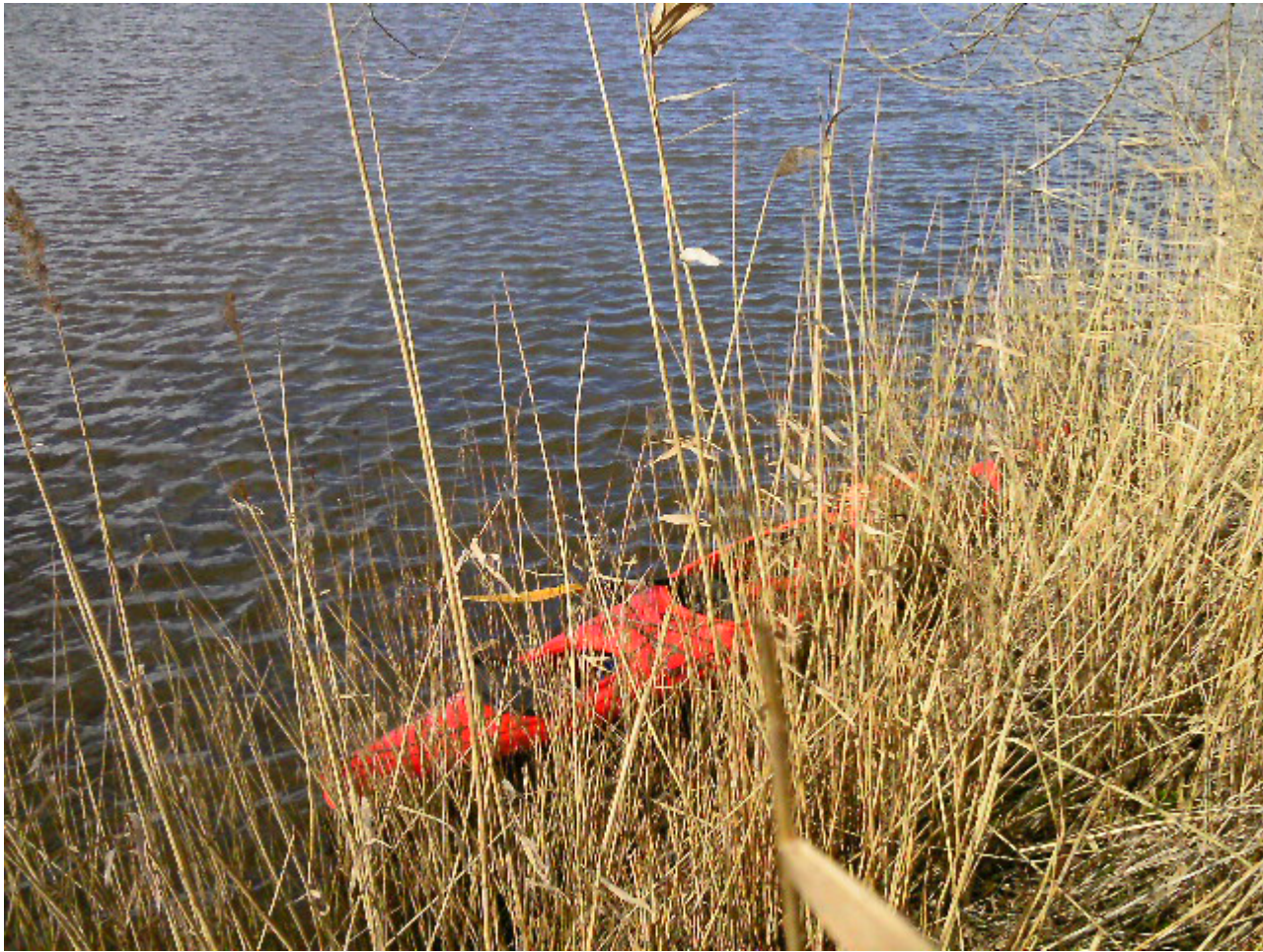
Dan terug verder tot de eerste brug over de Steenbergse vliet.