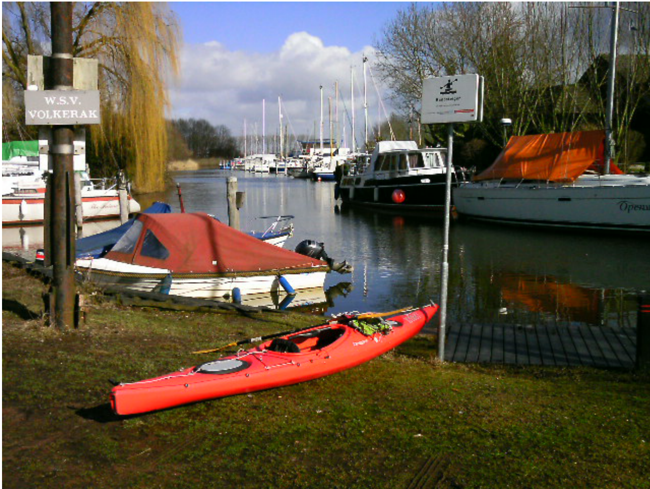
Het vertrek gaat langs de vlottende huizen in De Heen die gebouwd zijn op betonnen caissons