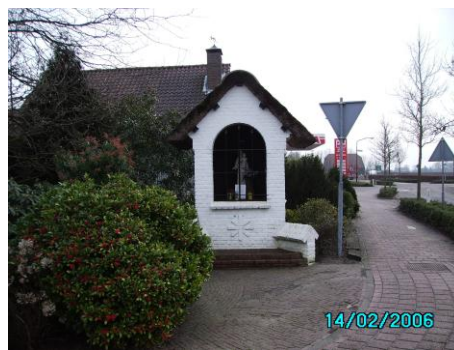
kapel in Rijsbergen

het wandelen vertrekken we weer om ca. 12.30 uur en vervolgen de route.