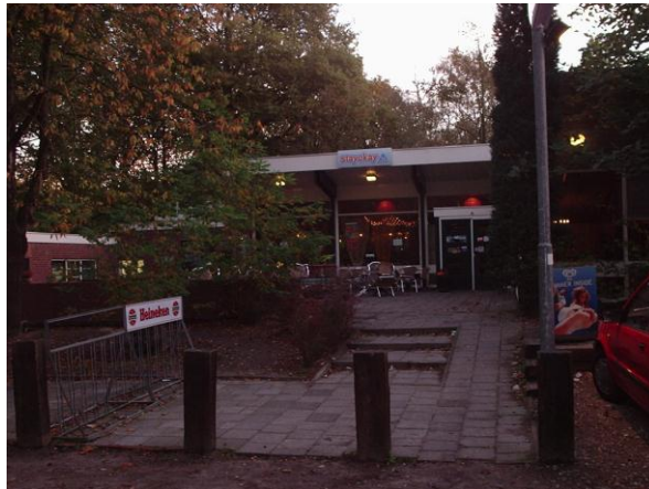
Stay Okay in Bergen op Zoom

limonadeglazen. Zeker een 3dubbele whisky. Het is een mooie dag geweest. Westerschelde, Oosterschelde en prachtig weer.