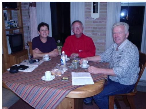
We zitten hier tenminste droog