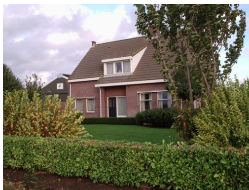
pension in Lamswaarde