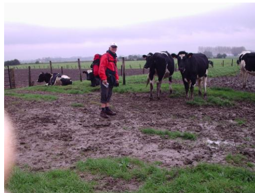
Wat een ellende tussen de dames

Het begint nu te regenen. We moeten over weilanden met lang gras en over prikkeldraden stappen. Mijn broek wordt al flink nat. Ik besluit de pijpen wat op te rollen, anders zit mijn broek zo dadelijk tot mijn knieën onder de klei.