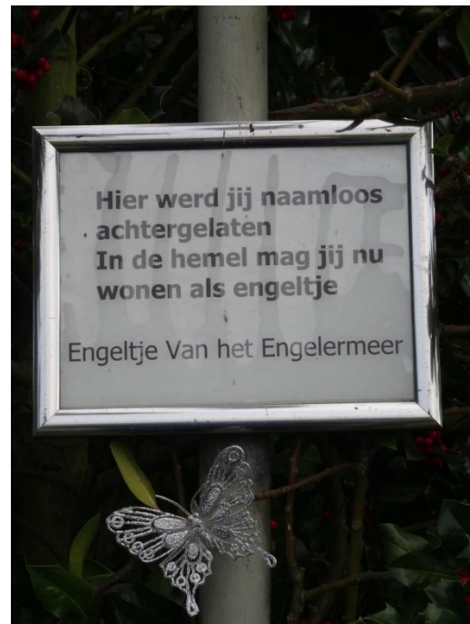
Engelen. Er zijn voldoende markeringen