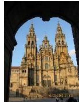
Santiago de Compostela