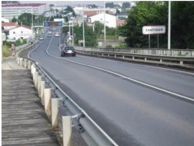
Santiago de C.