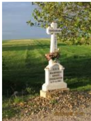
gedenkteken van een overleden Duitse pelgrim.

Naast de wegen zijn pas jonge bomen geplant. Deze geven geen schaduw. Het kan hier verschrikkelijk warm zijn. Er is dan geen enkele beschutting. Dit geldt vandaag voor de gehele route, behalve in de 2 dorpen.