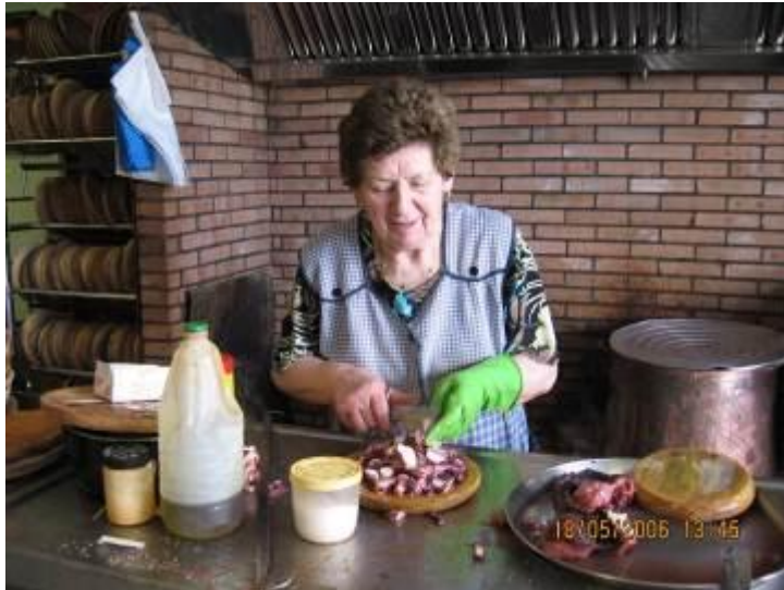
Pulpo wordt klaargemaakt

In hetzelfde restaurant is ook een internetcafé. Dus we maken er gebruik van om nog wat te mailen.