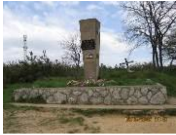
Franco monument uit 1938