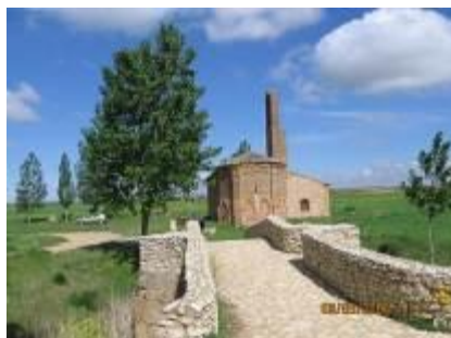
kapel met oude pelgrimsbrug