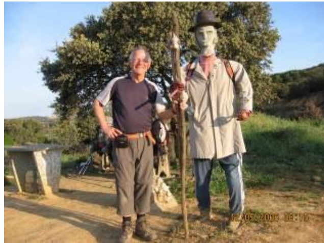
ik met een collega

Hij vertelt enthousiast over zijn belevenissen tijdens een sneeuwbus en mist. We komen uit bij een aangeklede pop, die een pelgrim uitbeeldt. We fotograferen de man.