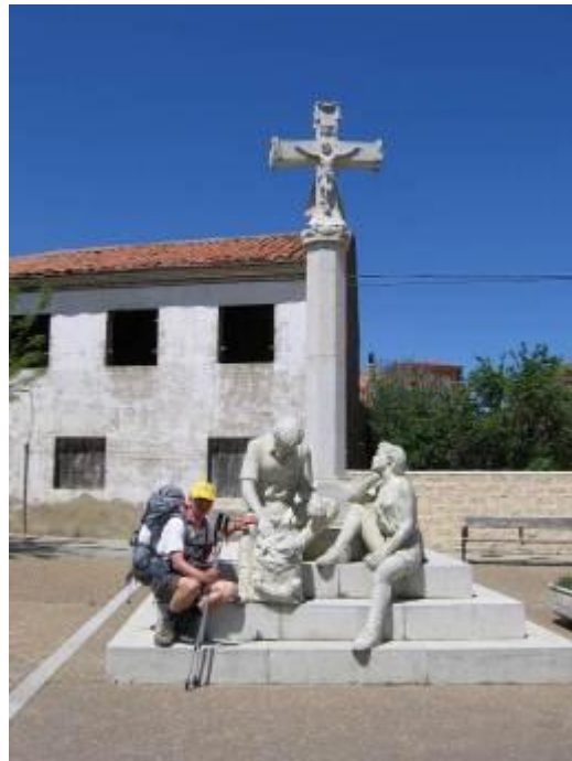
rusten met collega's