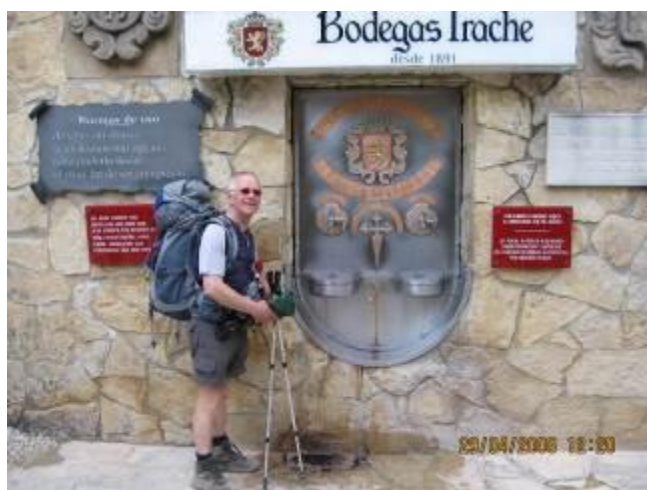
bron met water en wijn

Bij Irache kom ik bij de bron, die behalve water ook wijn tapt. Voor de formaliteit neem ik een slokje en doe wat in een flesje voor later tijdens het verslag schrijven. De kranen zijn van koper.