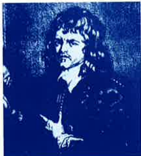
Portret van Hiëronymus Duquesnoy.

ontmoet, toen hij wat marmer moest afgeven in de kapel. Duquesnoy nam de jongen mee en ontblootte zijn bovenlijf om hem te portretteren. De volgende dag kwam Toussaint terug naar de kapel. Duquesnoy nam de hand van de jongen vast, stopte die in zijn broek en beval hem te masturberen terwijl hij ook de jongen zelf betastte. Daarna moest Toussaint zijn broek uitdoen,