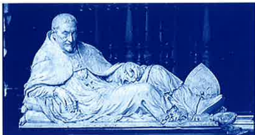
Praalgraf van bisschop Triest in de Gentse Sint-Baafskathedraal.

seksuele handelingen of toespelingen hun seksuele karakter verloren en neutraal werden.(10)