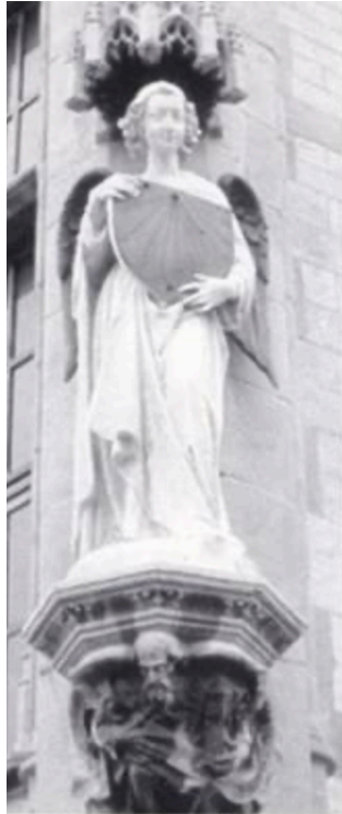
Engel met zonnewijzer