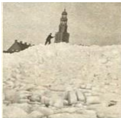
Neen, al erg was het gelukkig nog niet dat zelfs de toren van Bladelopen in het ijs verdween en dat iemand er zo maar tegen kon staan duwen. Het is alleen maar een grapje van onze fotograaf.