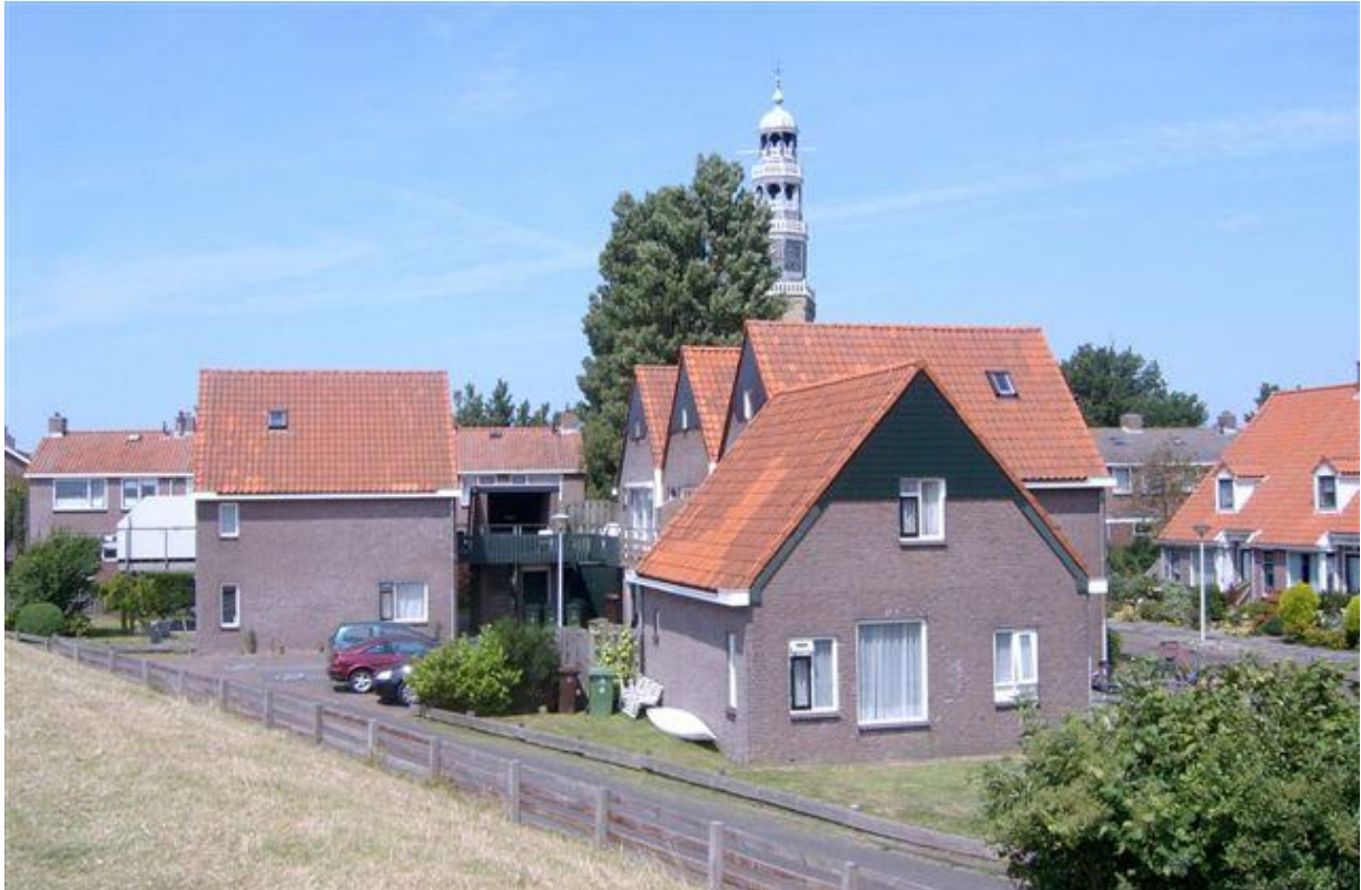
De flatjes (tranedal) aan de Molenstraat gezien vanaf de zeedijk

Gelijk met deze oude beelden verschijnt in verbeelding plotseling ook weer het vrijende paartje achter het hek bij 'Ids zijn hoofd' ten tonele. Eerst kan ik deze totaal verschillende beelden niet plaatsen. Na enige tijd, me afvragend over het waarom van deze verschillende beelden, vind ik de verklaring over het hoe en waarom dit op dat moment bij mij naar voren komt. In de jaren vijftig was dit, zo bedenk ik, de plaats waar menig beginnend scharretpartijtjes eindigde. Hier op dit donkere stukje weg, onder de brede goot van het brandspuithokje en van alle kanten in de luwte wisten vele jong geliefden zich onbespied. En wat anno 2008 in het openbaar langs de zeedijk wordt gedaan, gebeurde toen hier. En voor de zoveelste keer realiseer ik me dat er in feite niks is veranderd. Alleen wat wij in het geniep deden doet men nu in het openbaar en mag iedereen het zien als je iemand aardig vindt. Een oordeel over wat nu beter is laat ik achterwege.