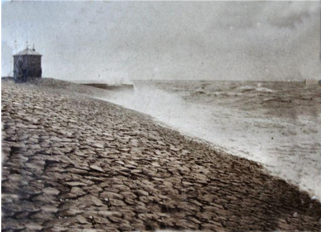
1925 De oude peilschaal op de Hon