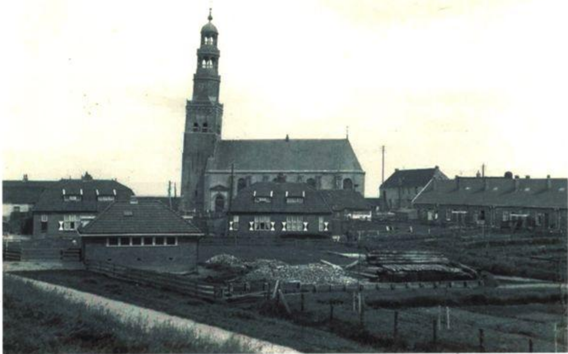
Het zogenaamde Juliana park circa 1930. Tussen de beide blokken huizen met gebroken kap loopt nu de Molenstraat,

Ongetwijfeld werden deze woningen toen als goed en modern gezien. Maar als ik aan deze woningen terug denk bemerk ik pas het contrast met de tegenwoordige huizen. Een kamer van 3,5 bij 3,5 of hooguit 4 bij 4, een klein zijkamertje van 2 bij 3,5, een keuken met zowaar stromend water en een toilet met ton op een paar meter afstand van keuken in de gang. Voor die tijd misschien een luxe maar naar de huidige maatstaven waren het woningen die we nu alleen maar op de televisie zien als er een reportage over ontwikkelingslanden voor is. Het zou nu bijvoorbeeld ondenkbaar zijn dat je een toilet (ton) had op enige meters afstand van de keuken. Ja inderdaad, er is in vijftig jaar tijd toch veel veranderd in dat stukje Hindeloopen. Ook in Hindeloopen heeft de tijd niet stil gestaan.