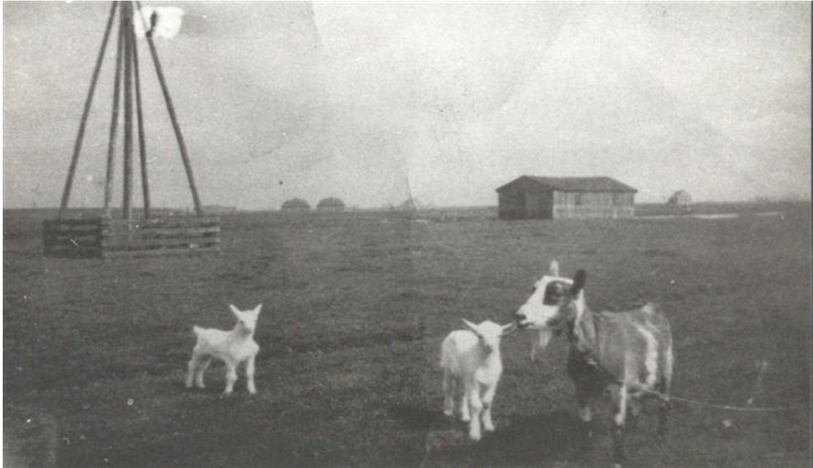
De Weide. Nu Stadsweide en Weidestraat.

trappetje op en blijven een ogenblik daar boven op de dijk staan. Dan zegt één van ons drieën “zullen we eindje de Badsdijk uit lopen? Schijnbaar valt dit idee bij alle drie in goede aarde want voordat iemand een reactie geeft lopen we alle drie in de richting van dit in 1912 gebouwde Badpaviljoen wat in verte boven op de dijk staat. Maar daar zijn we, zo u zult merken, nog lang niet. Ter hoogte van de Stadsweide/Weidestraat, vroeger gewoon de ‘de Weide’ genoemd, blijven wij alle drie zonder dat we het van elkaar weten stilstaan. Het lijkt wel alsof er een bordje staat ‘Stop, eerst terug naar vroeger’.