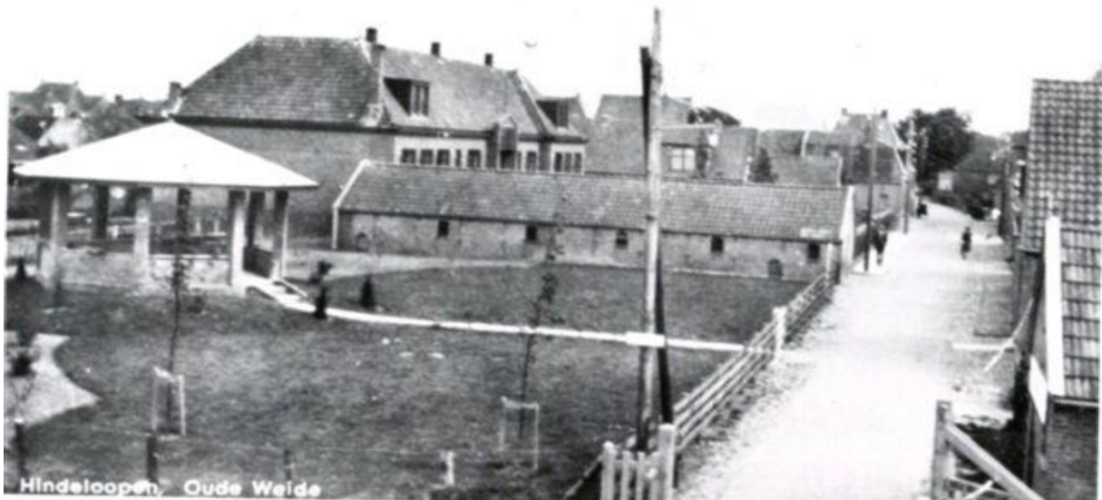
De Oude Weide circa 1920