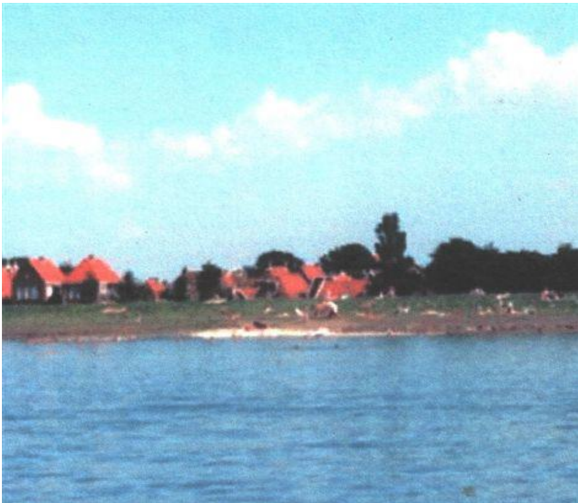
Ids zijn hoofd (Pier) vanuit het IJsselmeer

Het is een mooie nazomerdag. De thermometer geeft nog 20 graden aan en de zon gaat af en toe schuil achter een kleine witte wolk. Daar ik geen zin heb aan een of andere klus in huis loop ik naar de haven of zo men in Hindeloopen zegt “nei ‘t Aest”. Bij de reddingsloods staat een groepje mannen te praten en op het bankje zitten een aantal vrouwen het laatste nieuws uit te wisselen. Ik voeg mij bij de mannen en luister naar wat de gemoederen bezig houdt. Al snel merk ik dat de politiek het onderwerp van gesprek is. Gezien mij dat als klein radertje in het politieke bestel altijd wel interesseert spits ik mijn oren om niets van de discussie te missen. Al snel wordt mij duidelijk dat niemand het volgens deze ‘ingewijden’ goed doet en er nagenoeg niets deugd. In simpele beweringen, en niet gehinderd door de kennis van wat de echte achtergronden van de problemen zijn, worden in een handomdraai pasklare oplossingen aangedragen voor wereldproblemen waar de groten der aarde niet uit komen. Of deze, naar mijn idee, ongefundeerde kritiek en niet reële oplossingen nu terecht zijn of niet laat ik in het midden, maar echt interessant vind ik deze discussie niet. Ik bedenk dat ik waarschijnlijk meer zal genieten van een wandeling over de zeedijk. Ik groet de mannen, die het nog steeds over ‘de ander’ hebben een prettige verdere discussie toe en loop door het klaphekje op de dijk richting ‘Ids zijn hoofd’.