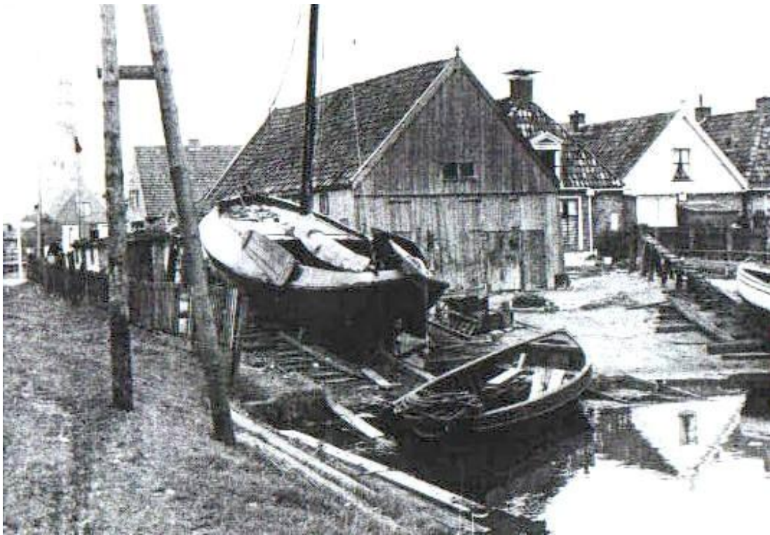
1945 De Weibrandshelling