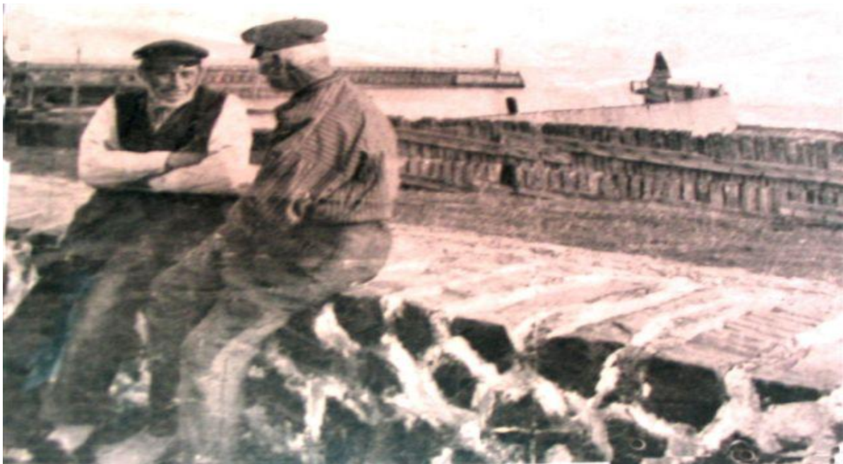
Mannen op de basalt muur

Om niet weer in een droom weg te zakken en ik nog steeds geen zin heb om één of andere klus op te pakken besluit ik maar weer eens op de haven te kijken. De politieke discussie zal nu wel afgelopen zijn, denk ik. En waarachtig mijn voorgevoel klopt. De bank bij de reddingloods is leeg. Niemand van een paar uur geleden staat er nog. Een eindje verderop, even voorbij de Hinde, zitten wat oudere mannen en vrouwen op de basaltmuur te praten. Dus loop ik door en ga op een nog vrij plekje tussen een paar mannen in zitten.