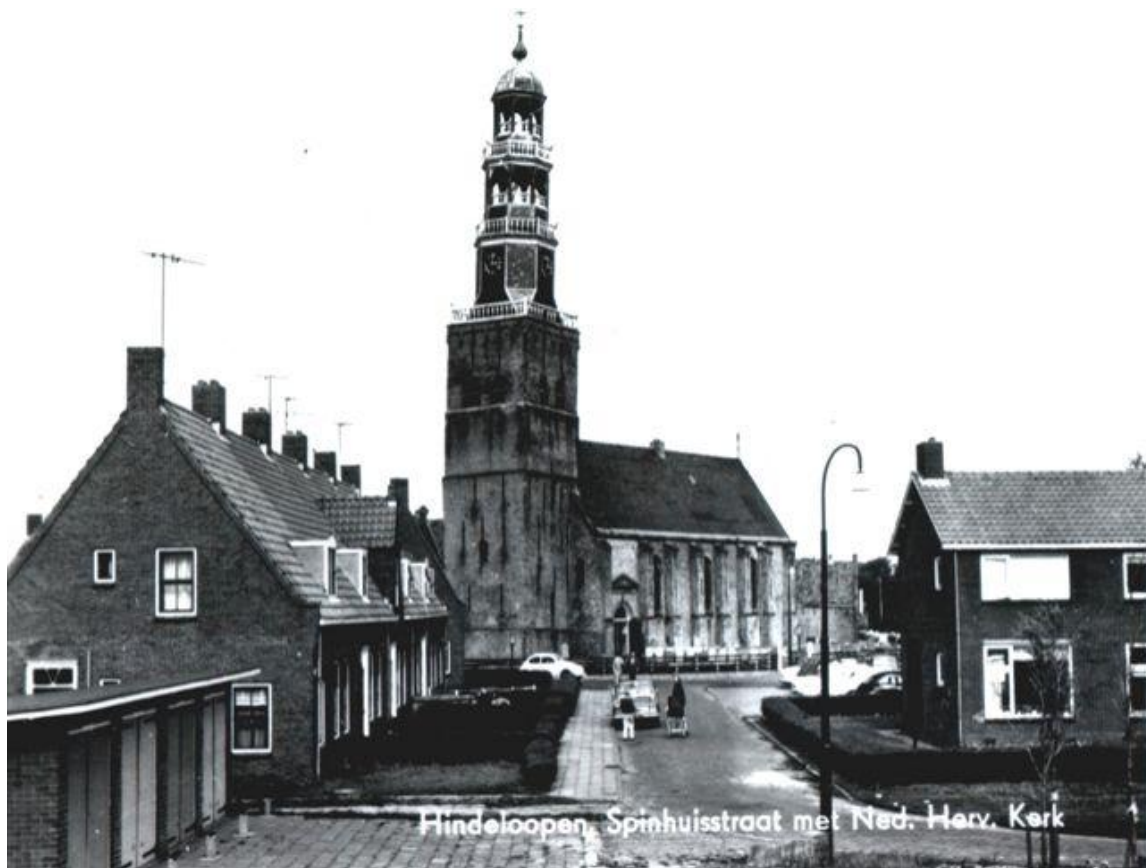
De Kerkstraat (nu Spinhuisstraat) circa 1965