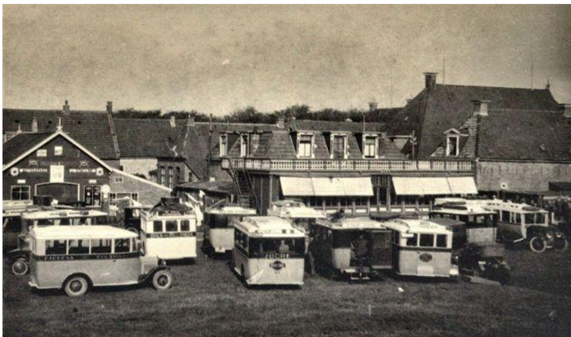
Foto circa 1923. Garage links is nu veel hoger en \pm 6 meter naar voren gebouwd. Nog meer naar voren is later een huis gebouwd. Rechts voor grote woning staan nu zomerhuisjes.

Waarschijnlijk heeft mijn verteller bemerkt dat ik niet helemaal bij het gesprek ben want plotseling stopt de “aald Hylper” zijn enthousiaste uiteenzetting van hoe het vroeger was. En net als een mens die wakker kan worden van een wekker die niet meer tikt ontwaak ik uit mijn droomwereld doordat mijn verteller stopt met vertellen. Vervolgens excuseer ik me voor mijn afwezigheid. “Och ik kan het wel begrijpen” zo zegt mijn gesprekspartner. “Ik draafde geloof ik ook wel wat door, want veel wat ik vertelde zal jou bekend zijn”. En terwijl hij naar het huis aan de overkant van het water wijst vraagt hij “want jij bent daar toch geboren?”. Nu inderdaad dat kan ik alleen maar bevestigen en inderdaad veel van wat hij vertelde was mij bekend maar ik vind het helemaal niet erg om het nog eens te horen.