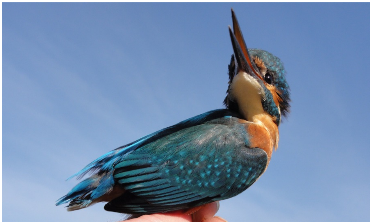
Joure 1 september 2012. Rohel Tjeukemeer SBB terrein Marswâl.

Na lange tijd eindelijk weer een vangst van een jong mannetje Ijsvogel op de ringplek.