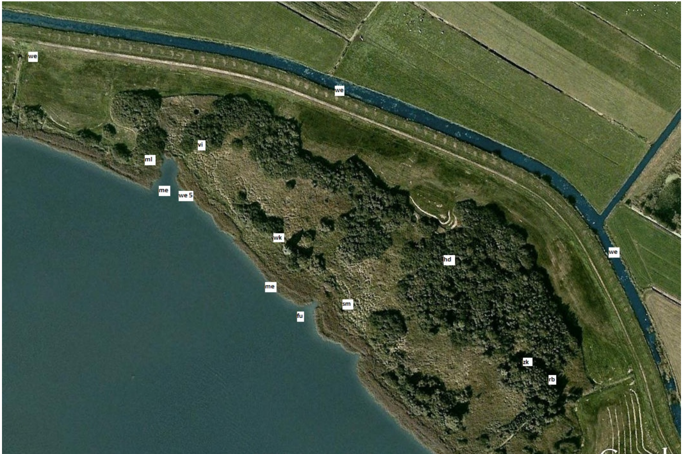
Telling midden deel Marswâl Tjeukemeer 7 april 2012.

Wilde eend 8 paar, Zwartkop 1 zingend, Merel 1 zingend, Winterkoning 1 zingend, Staartmees 2 vogels bij bosje achter elkaar aanjagend; Vink 1 mannetje zingend, Meerkoet 2 paar, Houtduif 1 paar, Roodborst 1 zingend. Verder aanwezig Fitis 6, Tjiftjaf 7, Zwarte kraai 2 overvliegend, Kuifeend 1 vrouw bij palenrij. Grauwe gans 1 paar overvliegend.