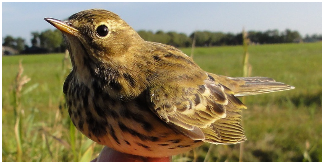
Joure 30-09-2012. Graspiepers lieten zich gemakkelijk met geluid vangen.

Nooit eerder (sinds 1985) werden er zoveel Graspiepers op deze ringplek gevangen. De vogels kwamen erg sterk op het geluid af. Zelfs toen we bij de netten stonden vielen ze in op het geluid.