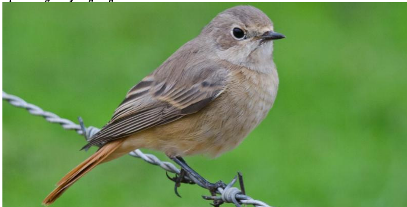
De Gekraagde Roodstaart wordt aan de noordoever van het Tjeukemeer maar weinig gevangen.