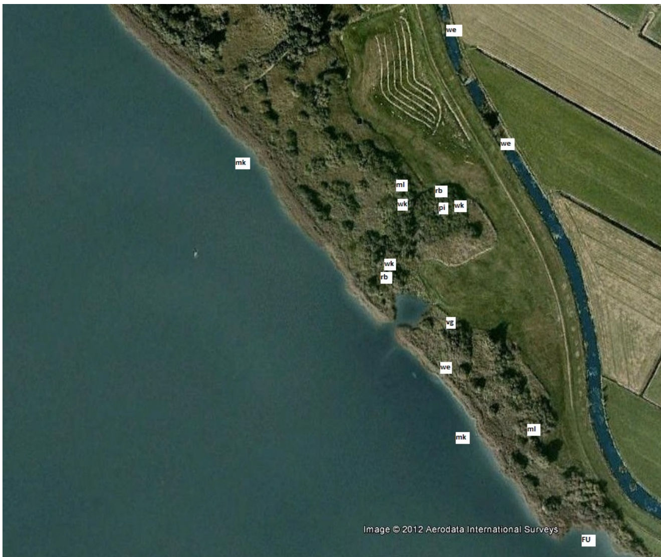
Telling Oostelijk deel Marswâl Tjeukemeer 7 april 2012.

Een groot deel van de wilgen moet nog uitlopen. De Fitis en Tjiftjaffen zijn stellig nog doortrekkers, niet ingetekend. Wat opvalt is dat er nog weinig zangvogels zijn in dit deel en in het geheel geen Grauwe gans . Vegetatie is nog dor. Op 2 plekken broeihopen van ringslangen.