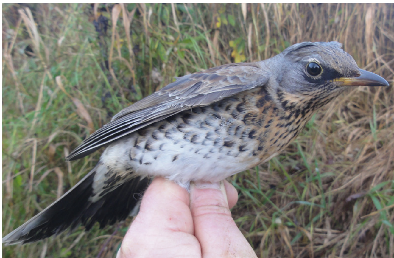
Kramsvogel in 2012 massaal op bezoek aan het Tjeukemeer.

CES LOKATIE C09 (ROHEL/FRIESLAND) KNAW/NIOO VOGELTREKSTATION WAGENINGEN SBB / SOVON