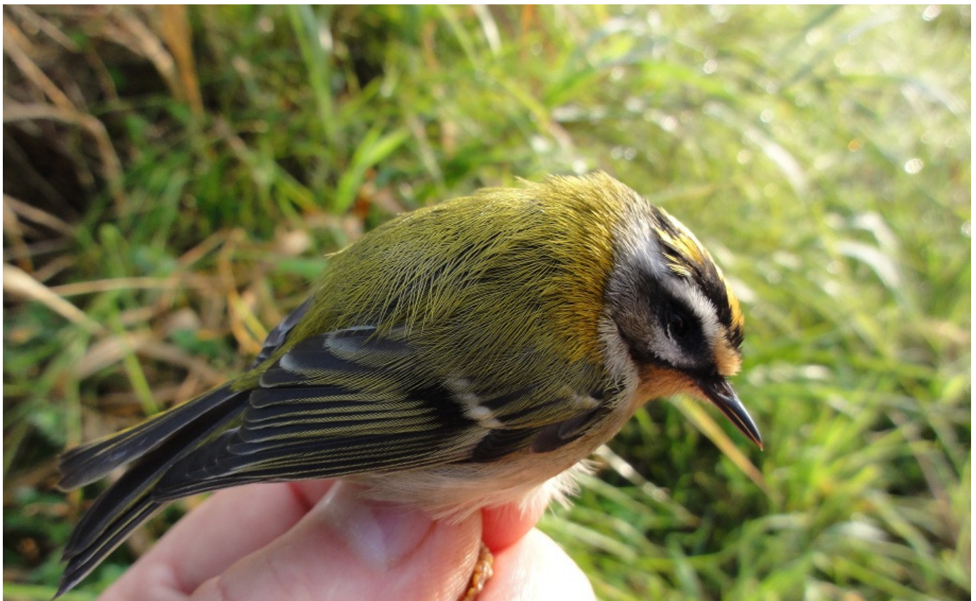
Joure 8 september 2012. Rohel Tjeukemeer SBB terrein Marswâl.

Buizerd 1 overvliegend naar W; Gaai 2 x 1 vogel naar O; Boerenzwaluw 15 tal aanwezig rond 9.00 uur; Wulp 1 overvliegend naar Z; Spreeuw na 9.00 uur kleine groepjes in lijsterbesboom, plus een 60 tal doortrekkend naar W; Pimpelmees enkele op de ringplek gehoord; Watersnip zeker 5 aanwezig bij slootje, later nog 2 elders opvliegend. Verder aanwezig 1 x Atalanta en 1 Bruine glazenmaker bij net B7.