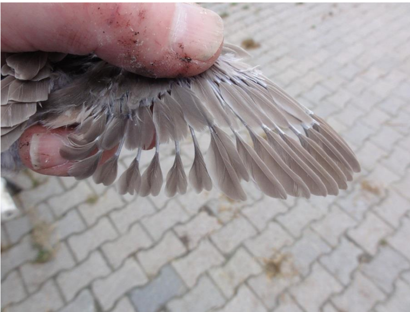
De grote en kleine slagpennen zijn nog flink in de groei.