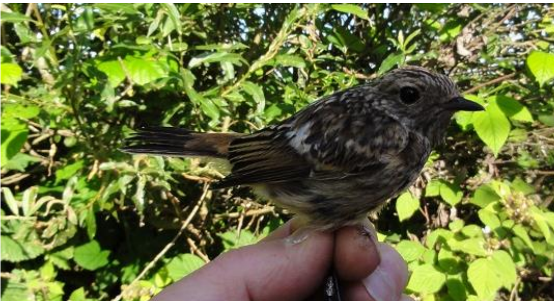
09-07-2019. Deze eerstejaars roodborsttapuit zat vanmorgen in de onderste vangbaan van net B14d.