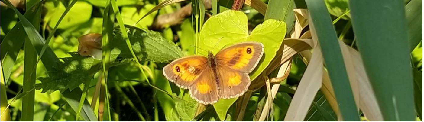
09-07-2019. Het oranje zandoogje (man) liet zich bij netbaan C9 op ringstation Rohel mooi zien.