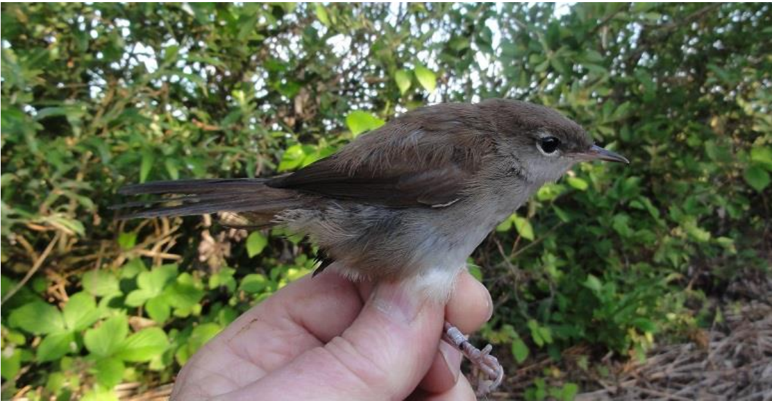
09-07-2019. Een eerste jaars Cetti's zanger gevangen in netbaan B15 van Ringstation Rohel.