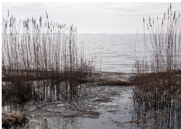
foto van baan C6-B6, 2/3 van B6 riet weg