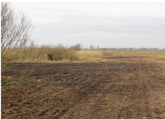
Foto vanaf ringplaats richting Oldeouwer