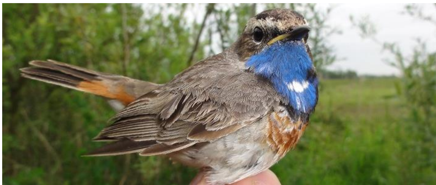
27 mei 2015. De witsterblauwborst laat zich in het SBB-gebied Marswâl horen en zien en behoort tot de jaarlijkse broedvogels aan de noordoever van het Tjeukemeer.

Lepelaar drie vogels naar O overvliegend; Koekoek drie vogels overvliegend al roepend naar W; Wulp 2 x overvliegend roepend eksemplaar; Grutto roep gehoord boven weilanden aan de Miekeveene; Scholekster af en toe enkele al roepend overvliegend; Fuut twee vogels langs de rietzoom; Meerkoet 1 paar aanwezig langs oever ringplek. Verder bij witte bruggetje 1 nest in aanbouw; Kauw twee vogels overvliegend naar O; Zwarte kraai 1 overvliegend; Knobbelzwaan 1 paar in kanaal ten O van witte bruggetje met vijf jongen; Gierzwaluw zeker vijf vogels aan het voedsel zoeken bij bosjes; Boerenzwaluw twee overvliegend; Nijlgans 1 paar in vlucht naar W; Blauwe reiger 1 overvliegend naar W; Braamsluiper twee zingend op de ringplek; Waterhoen 1 in het kanaal langs de polderdijk; Tuinfluitier zeker 3 paar aanwezig, vrijwel alle met broedvlek; Sprinkhaanzanger ontsnapte uit leefnetje waarin een klein gaatje zat, gelukkig vogel later weer terug gevangen; Kleine karekiet nog weinig vanmorgen, w.s. door weinig oud riet langs rietzoom, grote delen waren gemaaid in winter; Witsterblauwborst 1 mannetje zingend bij aankomst ten W van het witte bruggetje. Later in net C8 een mannetje (ongeringd) gevangen. Mogelijk 2 paar aanwezig?