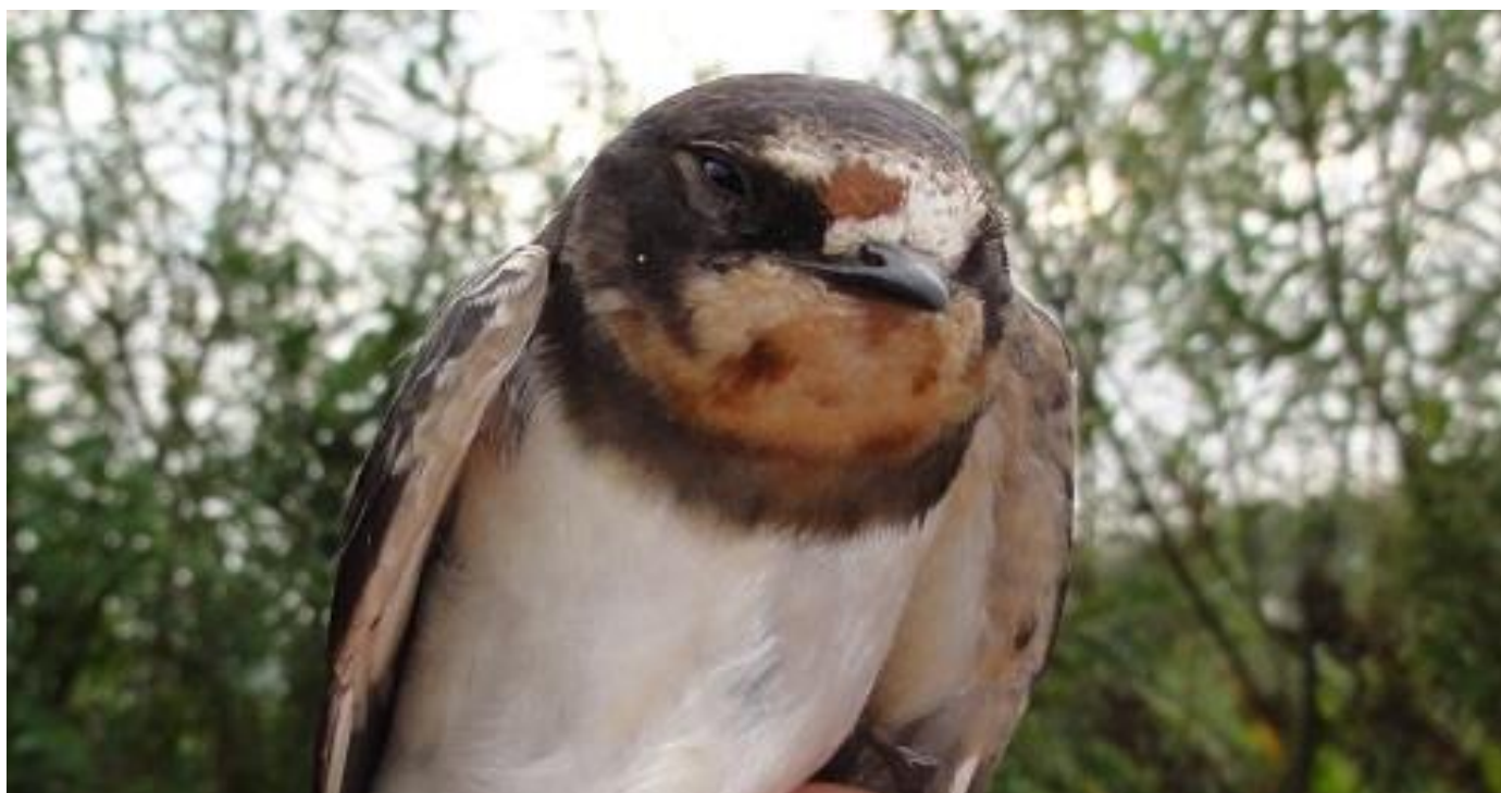
21 augustus 2015.

Bij aankomst in de rietzoom en struiken geen zang meer te horen. Nog weinig boerenzwaluwen en oeverzwaluwen aanwezig in rietzoom, wel enkele doortrekkende (alle 1kj) gevangen.