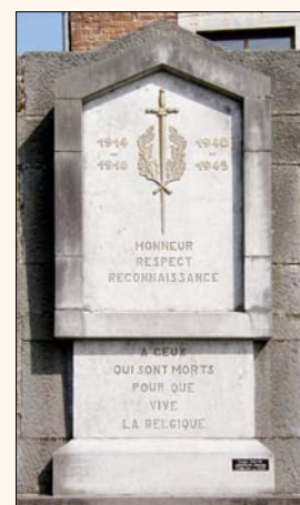
Grandhan - GRANDE-ENEILLE (dans le mur du cimetière entourant l'église Ste-Marguerite) Mémorial dédié aux victimes de la guerre 14-18 et de la guerre 40-45