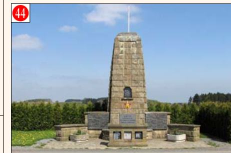
COMMUNE DE SOMME-LEUZE - BONSIN - Plaine Sapin

Monument dédié aux victimes de la guerre 14-18 et de la guerre 40-45. Initiative prise par la Commune de Wéris. Date de la cérémonie annuelle: Relais Sacré.