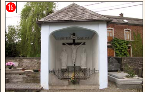
HEYD - Vôte dè Mârlî (dans la partie supérieure du cimetière entourant l'église) Chapelle construite à la mémoire des victimes des deux guerres (celles-ci, d'abord inhumées dans la chapelle, ont été exhumées vers les caveaux familiaux).

En 1942 et 1943, c'est sous l'impulsion de M. l'Abbé Maguin, curé de Heyd, et grâce à l'aide financière de ses paroissiens que furent érigés dans la Commune les cinq mémoriaux représentés en page 10. Il désirait qu'on se souvienne des prisonniers toujours en vie et des morts pour la Patrie. Ces monuments devinrent des croix de Rogations.