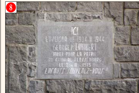
BOMAL s/O. - Rue des Ardenes (à l'intérieur du complexe scolaire)

Initiative prise par la Commune de Bomal. Date de la cérémonie annuelle: Relais Sacré.