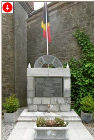
Bende - JENERET - Place Ysabeau Madame (devant l'église)