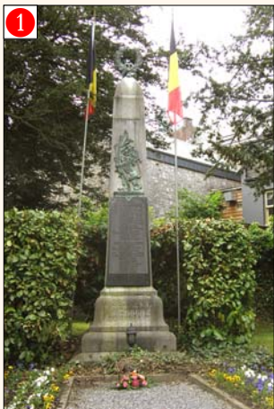
BARVAUX s/O. - Grand-Rue, 24 (près de l'Hôtel de Ville)

Monument dédié aux victimes de la guerre 14-18 et de la guerre 40-45 de la Commune de Barvaux.