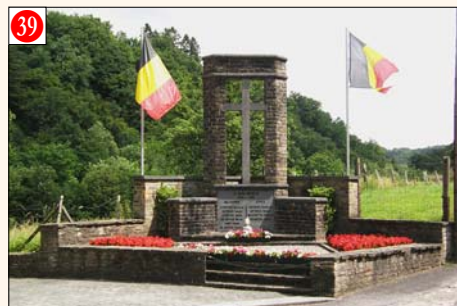
Tohogne - VERLAINE s/Ourthe Chemin des Charençons (en face de l'église)