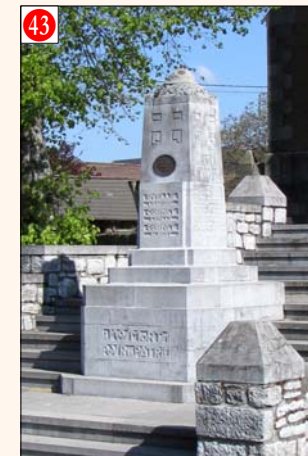
Wéris - OPPAGNE (devant l'église)

Coin droit de la place (à proximité immédiate de l'église) Monument 14-18 érigé à la mémoire des victimes de la Grande Guerre. Il comporte une représentation en bronze du Roi Albert 1 er . Une plaque 40-45 a été ajoutée plus tard. Initiative prise par la Commune de Villers-St-Gertrude. - Inauguré le 21 juillet 1930. Date de la cérémonie annuelle: Relais Sacré.