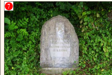
BOMAL s/O. - Route de Herbert (à gauche, à proximité de la bifurcation de Herbert)

Date de la cérémonie annuelle: Relais Sacré.