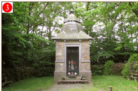
BENDE - Lieu-dit «A la Chapelle» (à mi-chemin entre Jeneret, Bende et Pielle)

Initiative prise par la Commune de Barvaux. Dates des cérémonies annuelles: le 8 mai et au Relais Sacré.