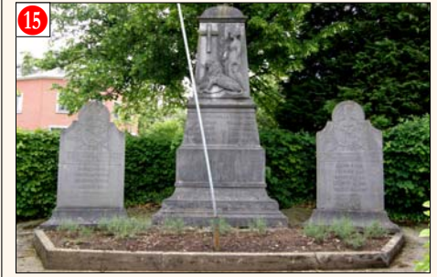
HEYD - Rowe dè Bati, 38 (au centre du village) Mémorial 14-18 et stèles 40-45 érigés à la mémoire des victimes des deux guerres. Initiative prise par la Commune de Heyd. Date de la cérémonie annuelle: Relais Sacré.