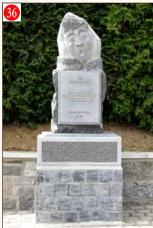
Tohogne - LONGUEVILLE au centre du village (à proximité de la ferme Dochain)

Mémorial 40-45 érigé à la mémoire des quatre victimes civiles de Longueville assassinées le 7/9/1944 par les nazis. - Réalisé par les sculpteurs Naja (Françoise Laffut) et Willy Camps. - Initiative prise par la Ville de Durbuy. Inauguré le 4 septembre 2009. Date de la cérémonie annuelle: Relais Sacré.