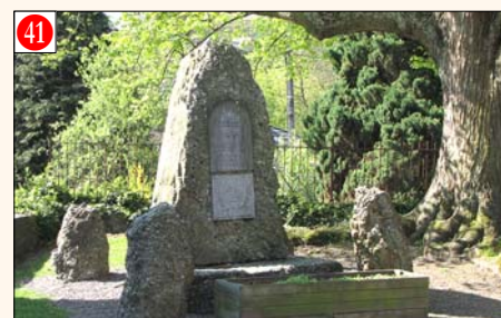
WÉRIS (dans l'ancien cimetière, à proximité directe de l'église romane)