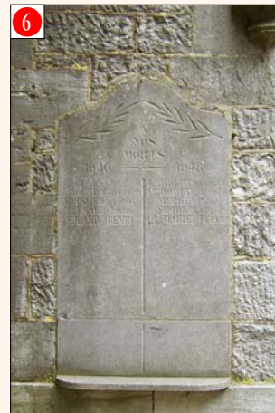
BOMAL s/O. - Eglise paroissiale (apposée à la tour, à droite de l'accès à l'église)

Initiative prise par l'Abbé Daussaint (omi) avec les anciens du village et la bienveillante collaboration de la Ville de Durbuy. Date de la cérémonie annuelle: Relais Sacré.