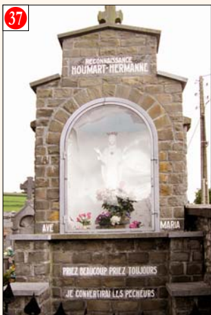
Tohogne - HOUMART (à l'entrée du cimetière)

Monument/tombe 14-18 érigé à la mémoire des victimes de la guerre 14-18 de la paroisse de Houmart. La pierre tombale est un don des familles Gathy. Date de la cérémonie annuelle: Relais Sacré.