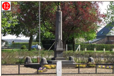
GRANDHAN - Place de Beaujeu (Enclos du Monument) Mémorial officiel de la Commune de Grandhan érigé à la mémoire des victimes des deux guerres. Initiative prise par les Groupements patriotiques. Date de la cérémonie annuelle: Relais Sacré.