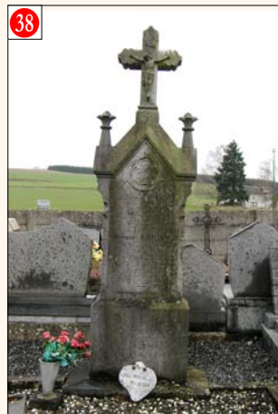
Tohogne - HOUMART (au centre du cimetière)

Mémorial 40-45 érigé à la mémoire des quatre victimes civiles de Longueville assassinées le 7/9/1944 par les nazis. - Réalisé par les sculpteurs Naja (Françoise Laffut) et Willy Camps. - Initiative prise par la Ville de Durbuy. Inauguré le 4 septembre 2009. Date de la cérémonie annuelle: Relais Sacré.