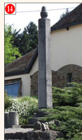
Grandhan - PETIT-HAN - Rue de Givet, 15 (coin de la rue de Givet et de la rue des Aguesses) Mémorial 14-18 et 40-45 érigé à la mémoire des victimes des deux guerres. Initiative prise par les Groupements patriotiques. Date de la cérémonie annuelle: Relais Sacré.