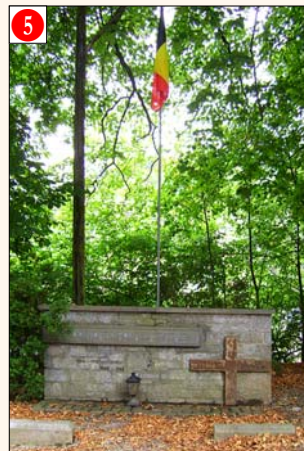
BOMAL s/O. - Place de l'Eglise (vers Izier, en amont à gauche, devant l'église)

Initiative prise par le Baron Paul Louis de Favereau.