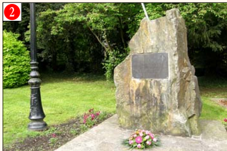
BARVAUX s/O. - Grand-Rue, 24 (près de l'Hôtel de Ville)

Initiative prise par les associations patriotiques.