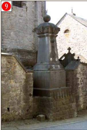
BORLON - Tier de Viné, 6 (contre le chevet de l'église de Borlon) Monument érigé à la mémoire des victimes des deux guerres. Date de la cérémonie annuelle: Relais Sacré.