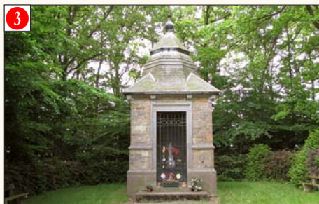
3 BENDE - Lieu-dit «A la Chapelle» (à mi-chemin entre Jeneret, Bende et Pielle)

Chapelle construite en reconnaissance aux victimes de la guerre 14-18 dont un mort au champ d'honneur, trois combattants morts en esclavage, sept ayant résisté à l'ennemi, deux déportés politiques et 17 déportés civils. Inaugurée en 1920.