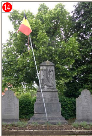
14 HEYD - Rowe dè Bati, 29 (au centre du village)

Mémorial 14-18 et stèles 40-45 érigés à la mémoire des victimes des deux guerres, sur une placette dans un petit enclos.