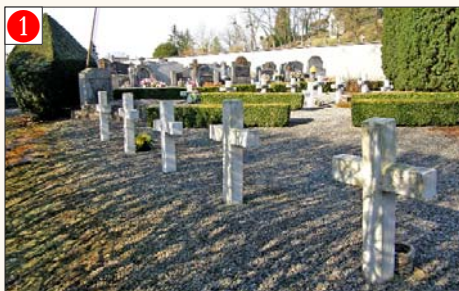
1 BARVAUX s/O. - Rue du Ténimont (au fond du cimetière central)

Nés de la Grande Guerre, dans un cimetière, sur une place publique ou en bordure d'un chemin, des monuments aux Morts, des chapelles, des plaques commémoratives, érigés dans la douleur des familles et des communes, bravent le présent, ridés par cent ans de témoignage. Ils entretiennent le souvenir par leur présence, ce que d'autres font par l'écriture ou la parole.