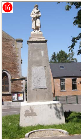
16 IZIER - Place de l'Eglise

Initiative prise par la Commune de Heyd. Date de la cérémonie annuelle: Relais Sacré.