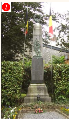
2 BARVAUX s/O. - Grand-Rue, 24 (près de l'Hôtel de Ville)