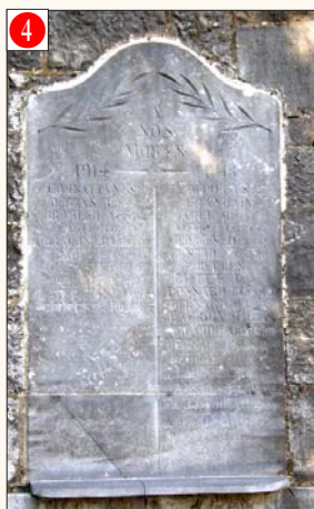
4 BOMAL s/O. - Eglise paroissiale (apposée à la tour, à droite de l'accès à l'église)

Dates des cérémonies annuelles: le 8 mai et au Relais Sacré.