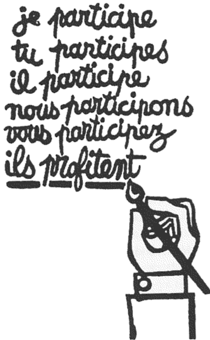
Fig 1. Poster : Ik participeer, gij participeert, hij participeert, wij participeren, gij participeert,.. Zij profiteren.

Originally Published as Arnstein, Sherry R. "A Ladder of Citizen Participation" JAIP, Vol. 3, No 4, July 1969, pp 216-224 . I do not claim any copyrights. Reprinted in "The City Reader" 1996 Routledge Press