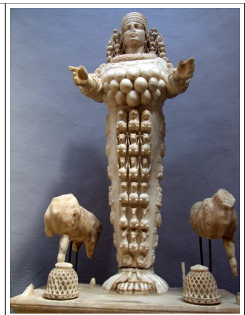
Artemis van Efeze

Aan de rand van Selçuk (een paar honderd meter van het museum) vind je de overblijfselen van het Artemesion, de tempel opgericht voor Artemis en ooit één van de zeven wereldwonderen . Eén armzalige zuil, waarboven in de lente meestal een nest van ooi-evaars. In het museum zelf, beslist een aanrader, vind je een afbeelding van Artemis.