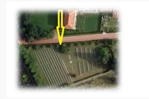
luchtfoto google maps

Achterevel poortgebouw, Centrale Begraafplaats van Brugge