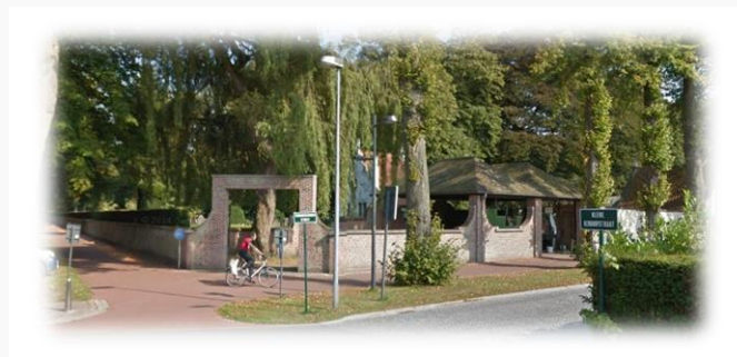
ingang kleine kerkhofstraat google Street view