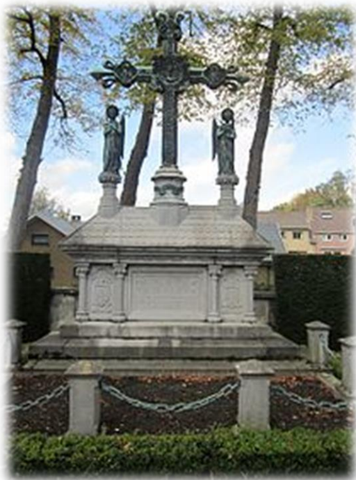
Graf van Guido Gezelle

Vervolg wetens waardigheden op deze begraafplaats