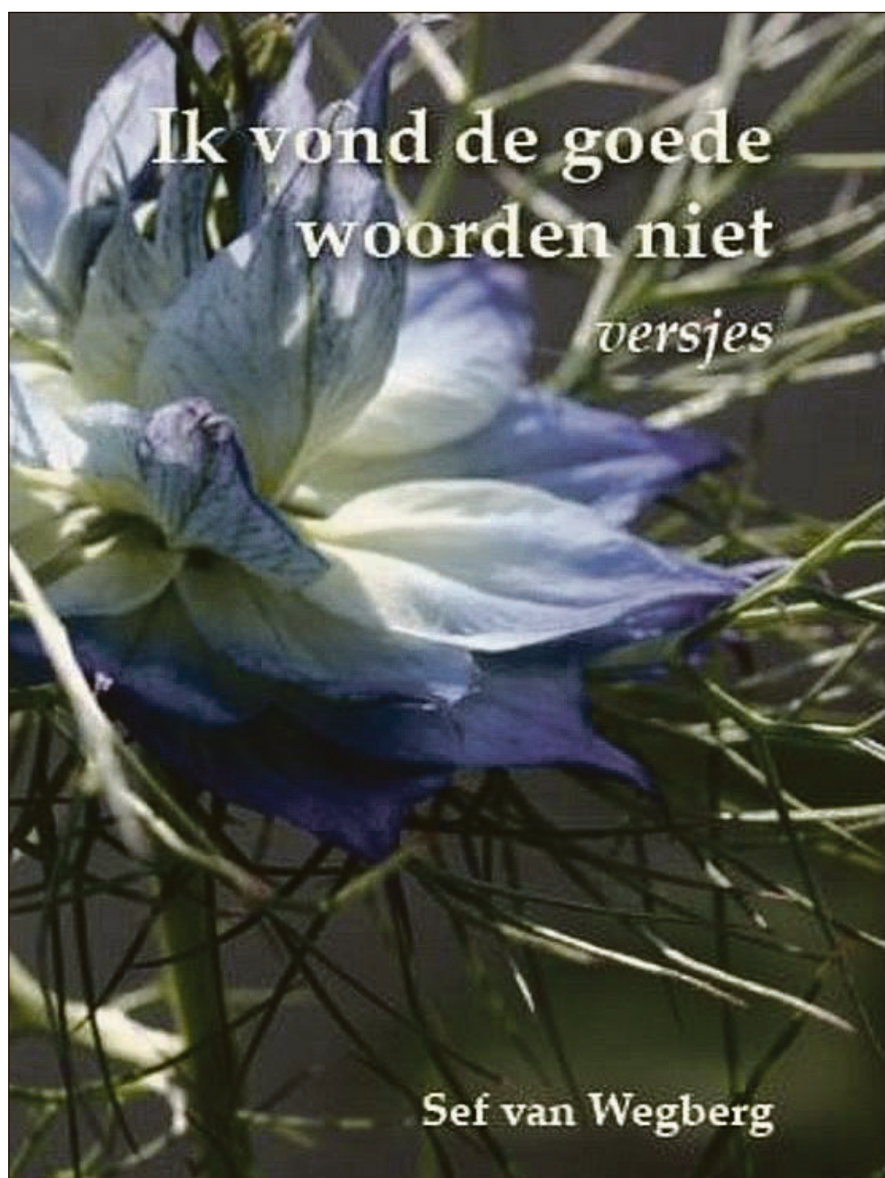
De nieuwste bundel van de 78-jarige Van Wegberg.

Echt - Tijdens voordrachten viel op dat met name de versjes met een ernstige ondertoon van Sef van Wegberg succes hadden. Bovendien stond er een tijdje geleden een versje van zijn hand op een rouwbericht. Deze twee feiten brachten dochter Ellen op het idee om een 'winterboekje' te maken: een verzameling van de mooiste eerder verschenen 'ernstige' gedichtjes aangevuld met een paar nieuwe, niet eerder gepubliceerde. Dit resulteerde deze maand in het verschijnen van de nieuwe bundel Ik vond de goede woorden niet - woorden om bij stil te staan . Sef van Wegberg is 78 jaar. Hij vond op oudere leeftijd een leuke hobby in het schrijven van gedichten en versjes. Deze nieuwe bundel is zijn vijfde sinds 2006.