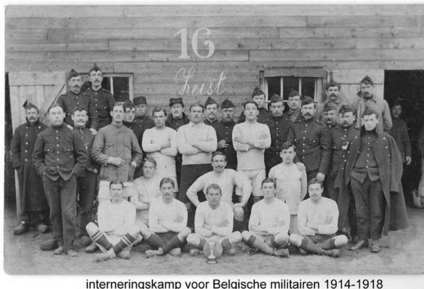
interneringskamp voor Belgische militairen 1914-1918