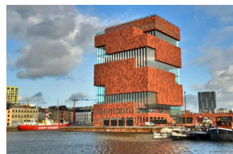
MAS: het museum aan de stroom.