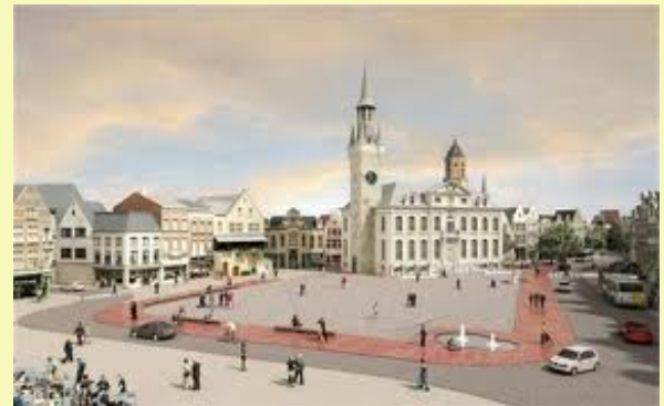
De Grote Markt van Lier

Kasteel A. Claeys Bouuaert te Mariakerke om 14.30 uur De locatie is vlot bereikbaar met het openbaar vervoer; buslijn 3 afstappen aan de halte Post Mariakerke, met buslijn 6 en 9 halte Mariakerkerk. Met de auto: aan Mariakerkerk, op het rondpunt noordwaarts, Notenstraat in tot op parking, te voet naar de ingang van het kasteel slechts 100 m.