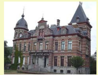
DE BRUID È DE PIESTE UIT

Dag 3, zaterdag 11/10 Tielt – Torhout. Dag 4, zondag 12/10 Torhout – Diksmuide.