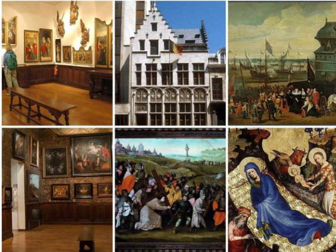
Het museum Mayer van Den Bergh.