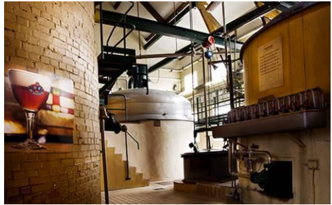
Het wordt boeiend, maar ook plezant

Dinsdag start men te Oost-Duinkerke, woensdag te Diksmuide, donderdag in Poperinge en vrijdag de slotdag te Ieper.