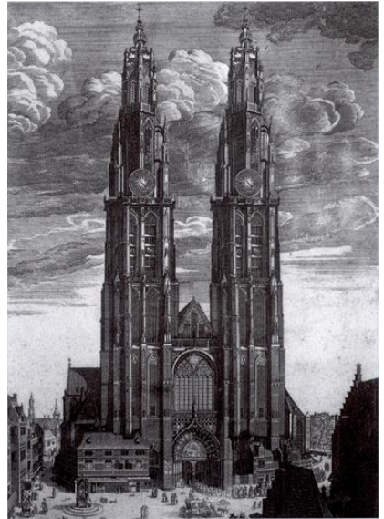
De O.L. Vrouwkathedraal

Deze bloei vertolkte zich in talrijke prachtige kunstwerken en gebouwen: de Antwerpse Grote Markt, de Beurs, het Elzenveld, maar vooral de trots van de Antwerpenaar, de O.L.V. kathedraal, is een product van vakmanschap en creativiteit.