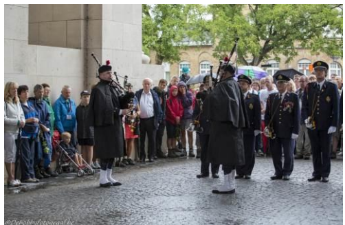
De slotherdenking onder de Menenpoort.