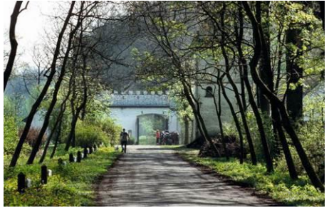
Toegangspoort tot de Drongengoedhoeve.