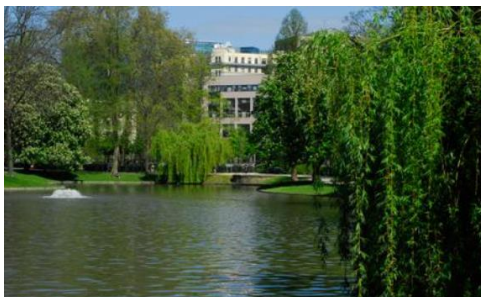
Het Leopoldpark, een oud landgoed, heeft nog steeds een beetje de stijl van een Engels landschapspark.