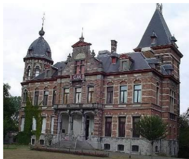
Kasteel A. Claeys Bouuaert te Mariakerke om 14.30 uur

Met de auto: aan het rondpunt Mariakerke kerk, noordwaarts, Notenstraat in tot op parking, te voet naar de ingang van het kasteel 80 m.