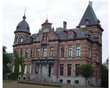
Kasteel A. Claeys Bouwaert te Mariakerke om 14.30 uur

Met de auto: aan het rondpunt Mariakerke kerk, noordwaarts, Notenstraat in tot op parking, te voet naar de ingang van het kasteel 80 m.