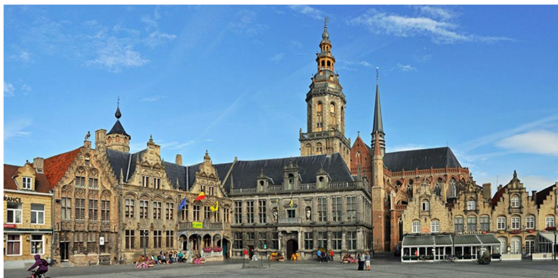
De Grote Markt van Veurne.