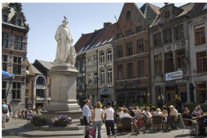
Grote Markt Halle

Halle is een stad van prachtig bewaarde historie en cultuur. Dit kleine stadje bruist ook van gezellige terrassen, evenementen, winkels en esthetische smalle straatjes.