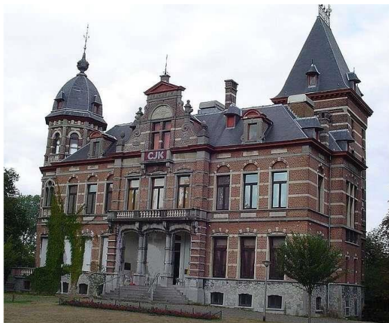
Kasteel A. Claeys Bouuaert te Mariakerke om 14.30 uur

De maandelijkse samenkomst gaat door in het kasteel Kasteel A. Claeys Bouuaert te Mariakerke om 14.30 uur.