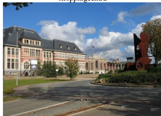
De oude mijngedebouwen.

Bus De Lijn: naar Maasmechelen Village en Connecterra.