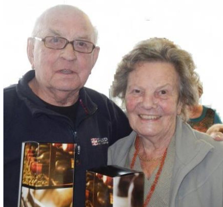
De winnaars van het paastornooi 2015.