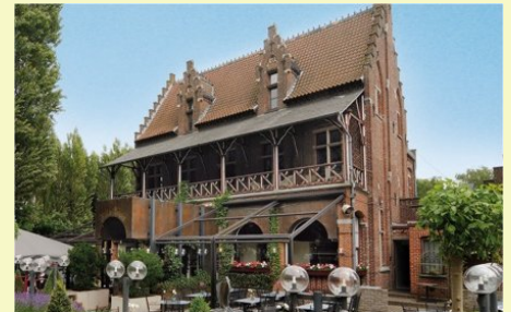
Hotel De Lourdes